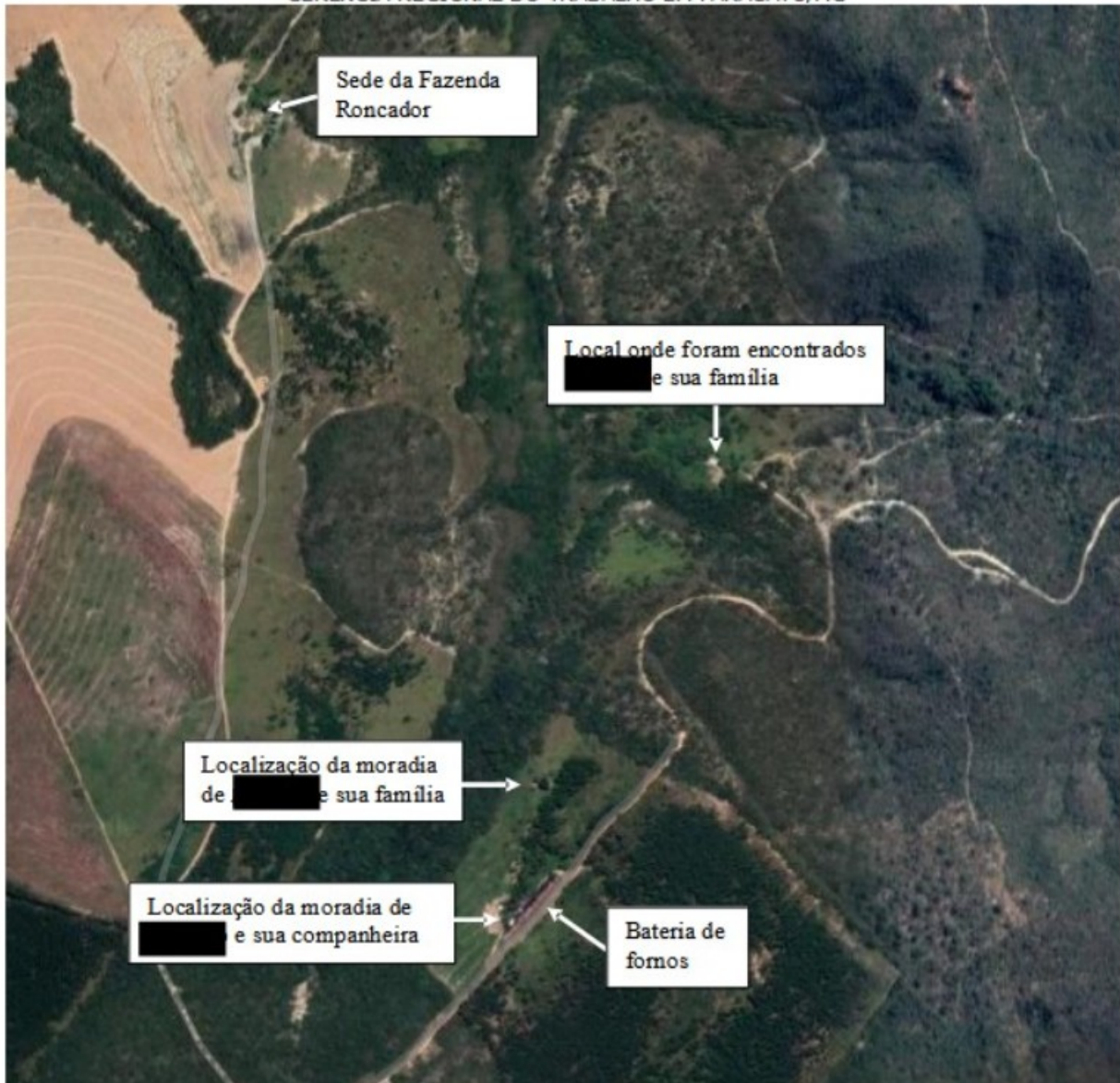
Imagem 2. Vista aérea da Fazenda Roncador.

A fiscalização foi informada que [REDACTED] se encontrava na sede da fazenda e então se deslocou até o local, nas proximidades das coordenadas geográficas -18.135636, -46.407861, onde foi encontrado e entrevistado. Em declaração prestada à fiscalização, com o testemunho dos Policiais Militares, ele informou que arrendava a fazenda para a produção de carvão e que pagava aos proprietários do imóvel rural entre R$35,00 e R$40,00 pelo metro cúbico de madeira cortada. Também informou que era o único responsável pelo estabelecimento rural e que auferia o lucro pela produção de carvão, mas também respondia pelo prejuízo, caso ocorresse. [REDACTED] confirmou que [REDACTED] e [REDACTED] trabalhavam na fazenda, porém não haviam sido registrados. Alegou que não entendia o motivo da saída dos dois da fazenda, porém acabou por confirmar que havia feito ameaças em momento de raiva. Ele também confirmou que fora [REDACTED] que já trabalhava com ele há muito tempo, que havia combinado a vinda de [REDACTED] e sua família para a fazenda. [REDACTED] informou que anteriormente o serviço de corte de árvores era feito por ele próprio, porém, em virtude de problemas de saúde, teve que parar com esse tipo de atividade, o que o levou a contratar [REDACTED] para fazê-lo. Declarou, ainda, que não havia combinado o corte de