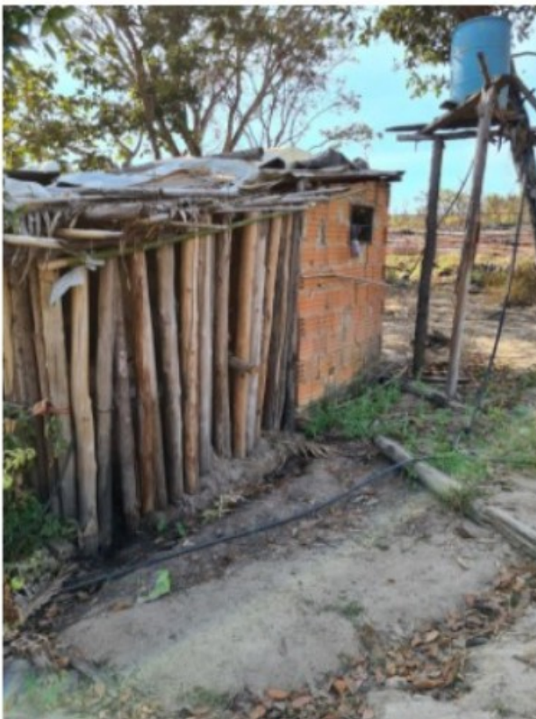
Imagem 8. Vista da caixa d'água existente na moradia de [REDACTED]. Registro fotográfico efetuado em 05/08/2021.