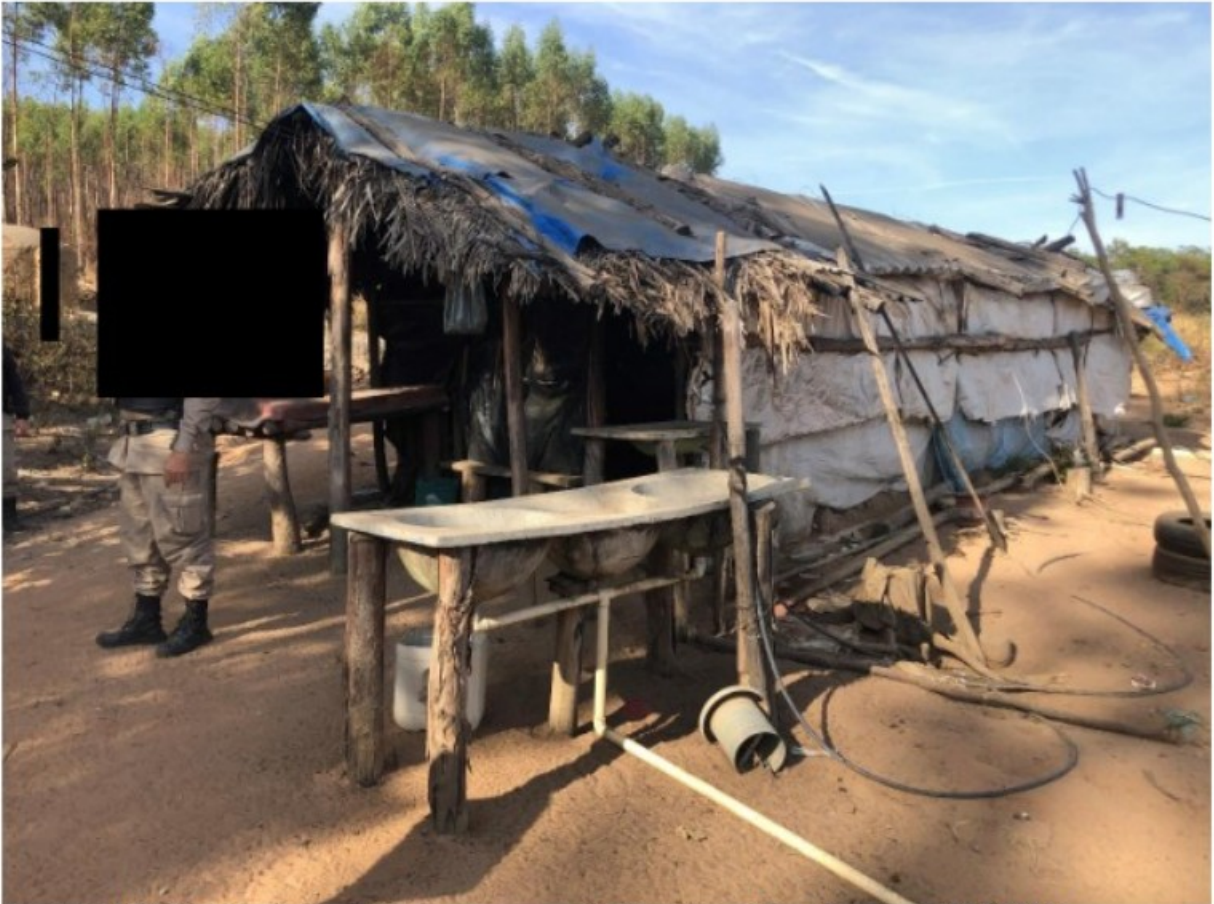
Imagem 10. Vista da moradia utilizada por [REDACTED] Registro fotográfico efetuado em 05/08/2021.

No lado externo havia uma caixa d'água improvisada com um tambor metálico, semelhante àqueles utilizados para o transporte de óleo mineral. Não foi possível precisar se o tambor fora reutilizado. Ao lado da edificação e dessa caixa d'água havia um buraco no chão que anteriormente havia sido utilizado como fossa séptica e que não estava completamente vedado, o que possibilitava a queda de pessoas e animais em seu interior.