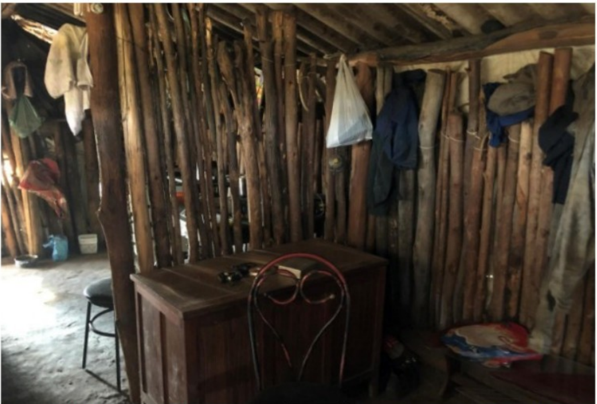
Imagem 12. Vista do interior da habitação utilizada por [REDACTED] e sua companheira. Registro fotográfico efetuado em 05/08/2021.