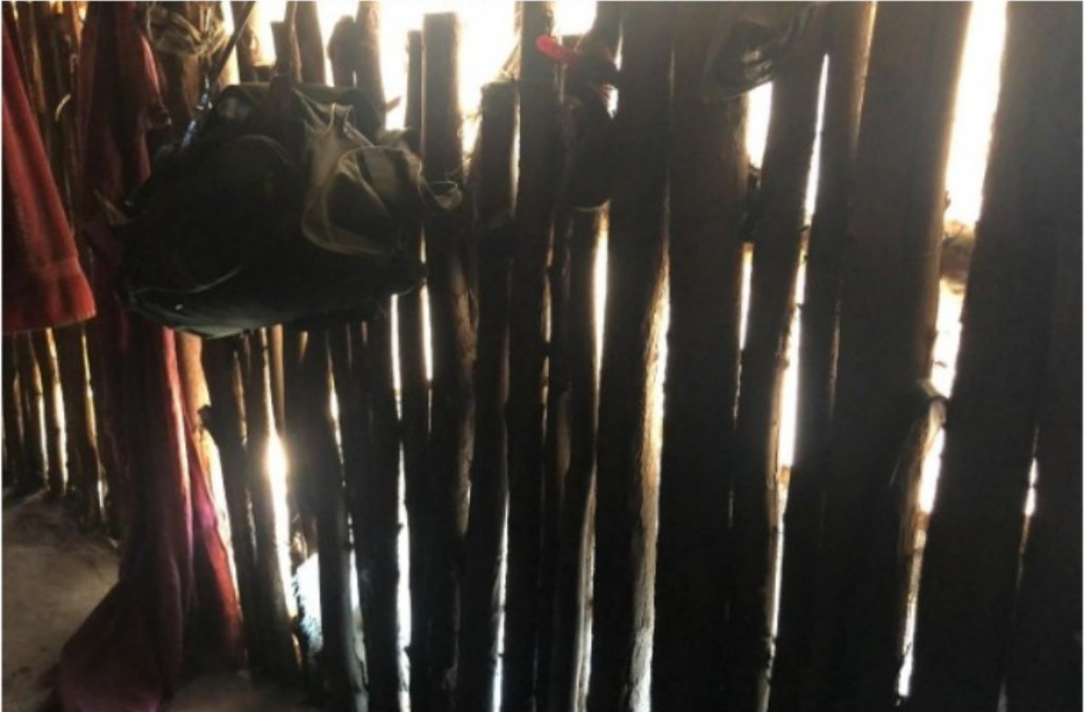
Imagem 11. Detalhe das “paredes” da moradia utilizada por [REDACTED] Registro fotográfico efetuado em 05/08/2021.