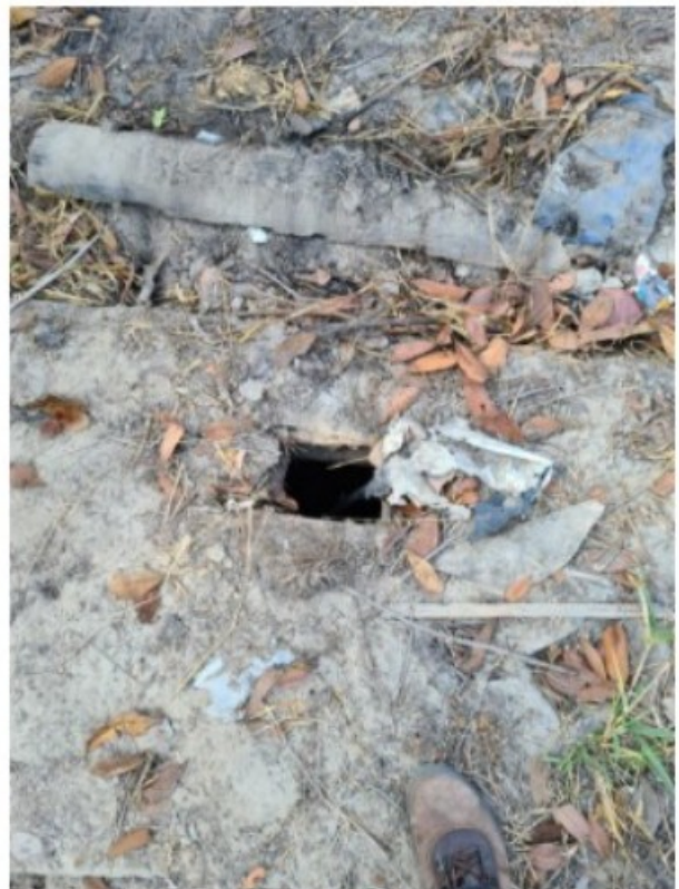
Imagem 9. Abertura de antiga fossa existente do lado da moradia utilizada por [REDACTED]. Registro fotográfico efetuado em 05/08/2021.