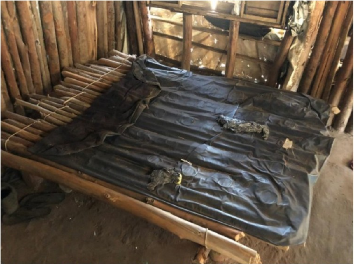
Imagem 13. Cama improvisada existentes no quarto da moradia utilizada por [REDACTED]. Registro fotográfico efetuado em 05/08/2021.

Todo o espaço apresentava higienização precária, com restos de comida deixados sobre o fogão. O mobiliário, especialmente o armário e geladeira, estavam impregnados com sujeira e fuligem. Conforme apurado pela fiscalização, o mobiliário existente nessa edificação pertencia ao empregado.