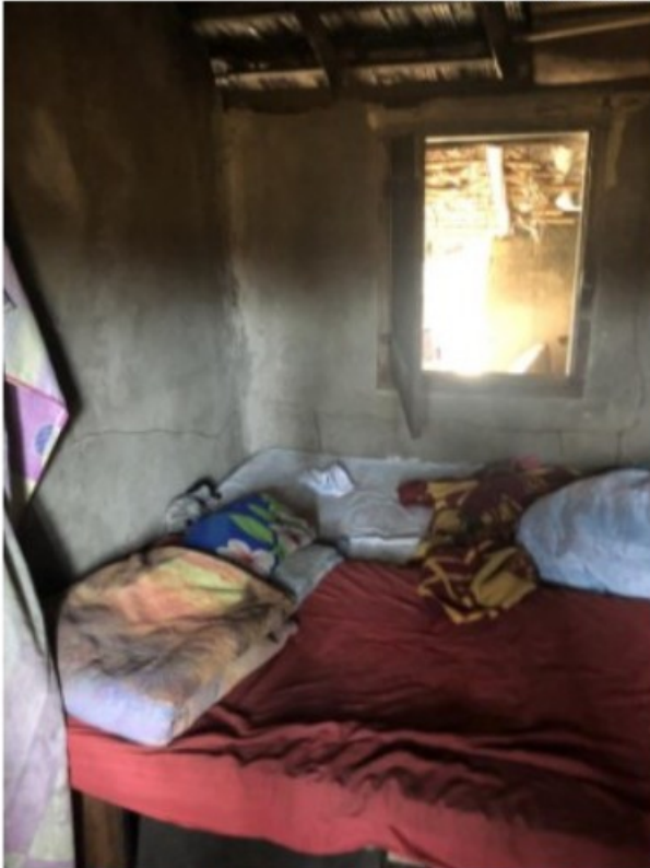
Imagem 6. Camas improvisadas existentes no quarto da moradia utilizada por [REDACTED]. Registro fotográfico efetuado em 05/08/2021.