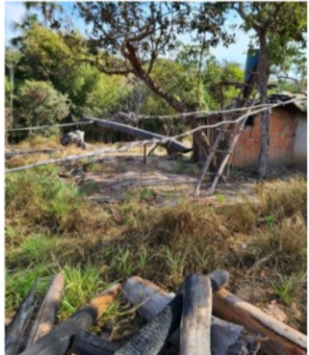
Imagem 15. Detalhe dos condutores elétricos que alimentavam a moradia utilizada por [REDACTED] sem qualquer isolamento. Registro fotográfico efetuado em 05/08/2021.