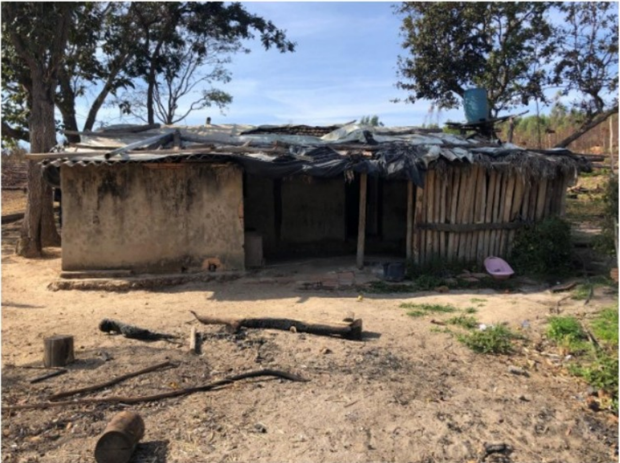
Imagem 3. Vista da moradia utilizada por [REDACTED]. Registro fotográfico efetuado em 05/08/2021.

Durante a inspeção a equipe de fiscalização teve acesso às edificações utilizadas por [REDACTED] e sua família e por [REDACTED] e sua companheira.