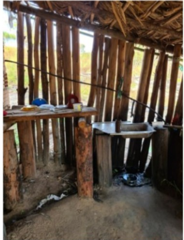
Imagem 7. Pia e jirau existentes na varanda da moradia utilizada por [REDACTED]. Registro fotográfico efetuado em 05/08/2021.