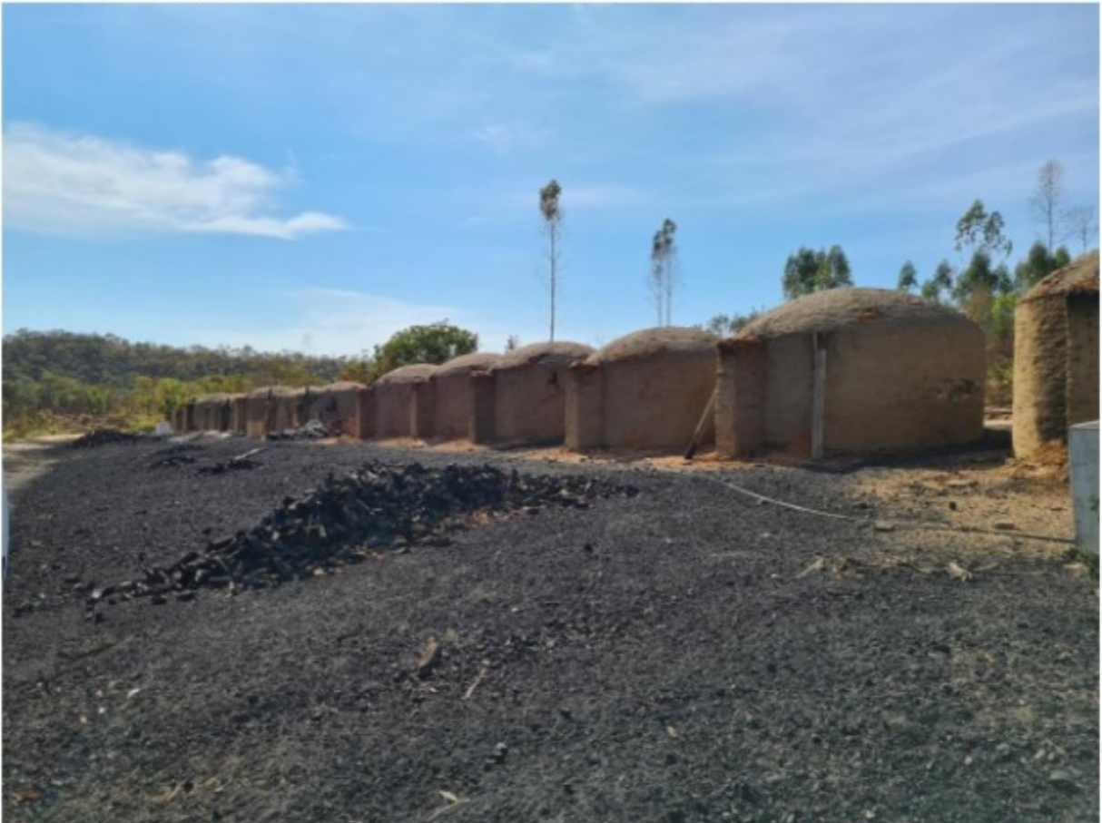
Imagem 1. Vista da bateria de fornos da Fazenda Roncador. Registro fotográfico efetuado em 05/08/2021.

Conforme apurado no curso da ação fiscal, [REDACTED] firmou, em 27/04/2018, “contrato particular de exploração florestal” com os proprietários da Fazenda Roncador para produção de carvão vegetal com a madeira oriunda da floresta de eucaliptos plantada no estabelecimento rural. Os proprietários do estabelecimento rural, de acordo com esse contrato eram [REDACTED] CPF [REDACTED] e [REDACTED] CPF [REDACTED]. De acordo com esse contrato, todo o ônus para a produção do carvão ficaria ao encargo de [REDACTED].