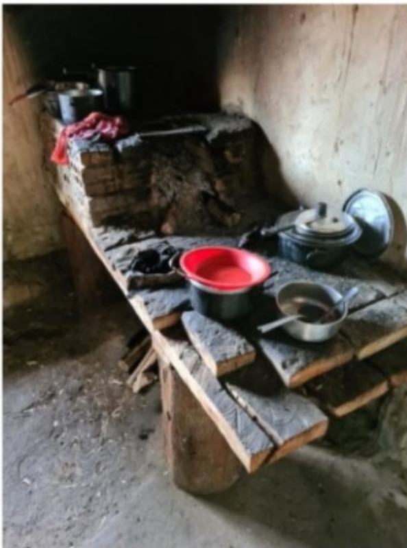
Imagem 4. Fogão a lenha existente no interior da cozinha da moradia utilizada por [REDACTED]. Registro fotográfico efetuado em 05/08/2021.

para abrigar toda a família, havia também uma cama improvisada com tocos de madeira e troncos de bambu, que era utilizada por [REDACTED]. No quarto foram improvisadas duas camas com tocos e ripas de madeira e troncos de bambu e que ficavam encostadas lado a lado. Elas eram utilizadas por [REDACTED] e as duas crianças. Também havia um jirau sobre o qual estavam ainda dispostos alguns pertences da família. Também havia um pequeno cômodo que era utilizado como local de banho. Nele havia apenas um chuveiro elétrico que não estava funcionando, não aquecendo a água. Não havia vaso sanitário e nem lavatório. Devido à ausência de vaso sanitário e mesmo de fossa séptica, os moradores tinham que fazer suas necessidades fisiológicas ao relento, no meio da vegetação circundante. Na varanda havia um sofá, um pequeno jirau com alguns utensílios de cozinha e uma pia, que era a única existente e apresentava várias partes quebradas. As águas servidas escorriam pelo chão, não havendo qualquer sistema de coleta dessas águas.