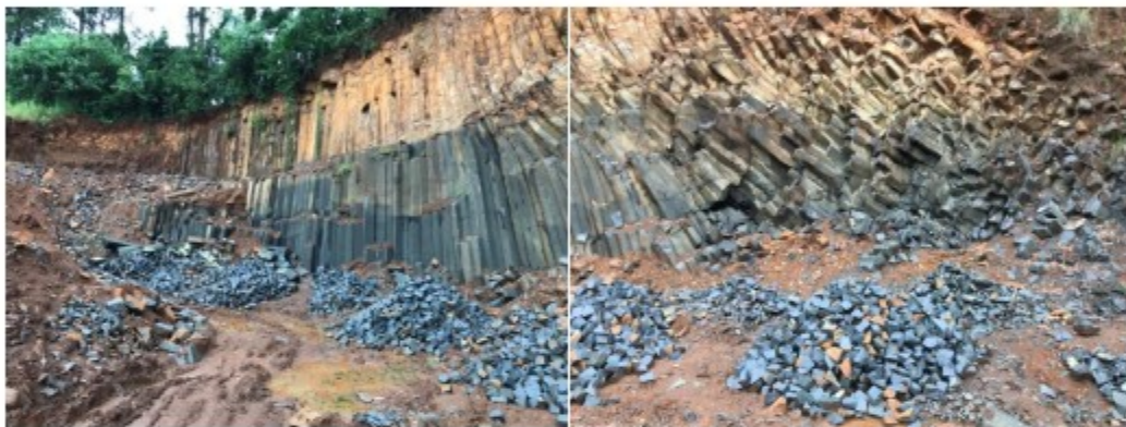
Imagens acima: pedras extraídas formando montes.

O GEFM, diante dos indícios de atividades de extração e britamento de pedras, adentrou na propriedade localizada às coordenadas 26°30'13.976"S 52°43'9.515"W, e encontrou uma edificação, localizada às coordenadas 26°30'14.452"S 52°43'11.772"W. No entanto, não foi encontrado qualquer trabalhador no local, motivo que impediu realizar outros atos de fiscalização.