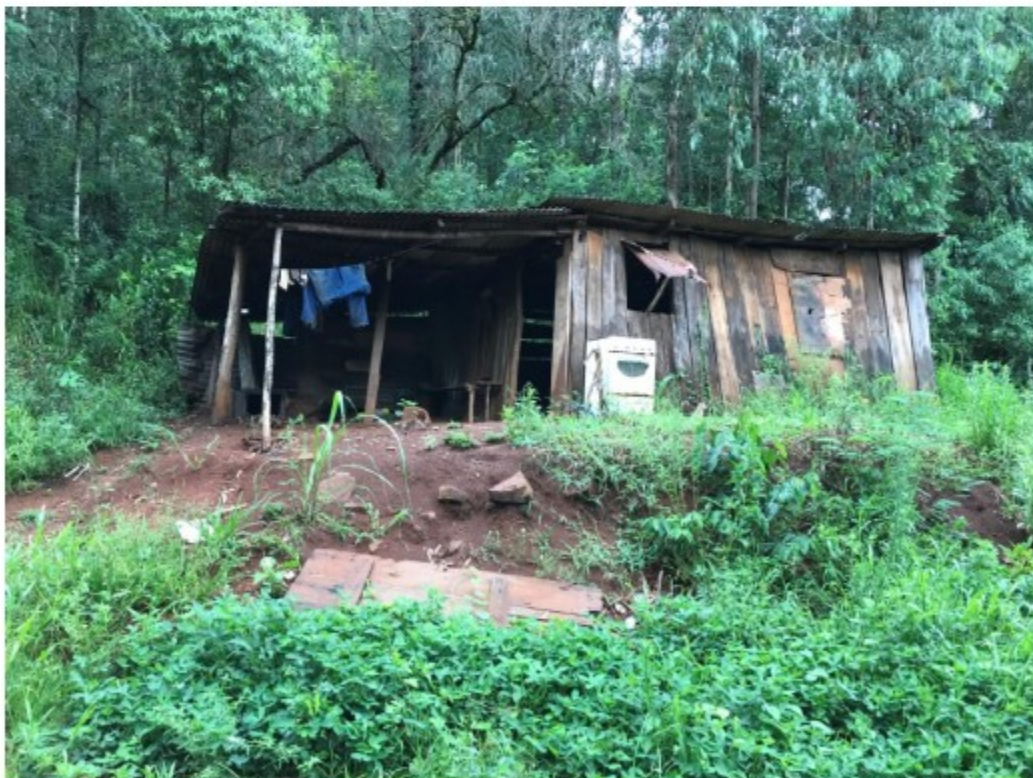
Imagem acima: edificação na entrada da pedreira.