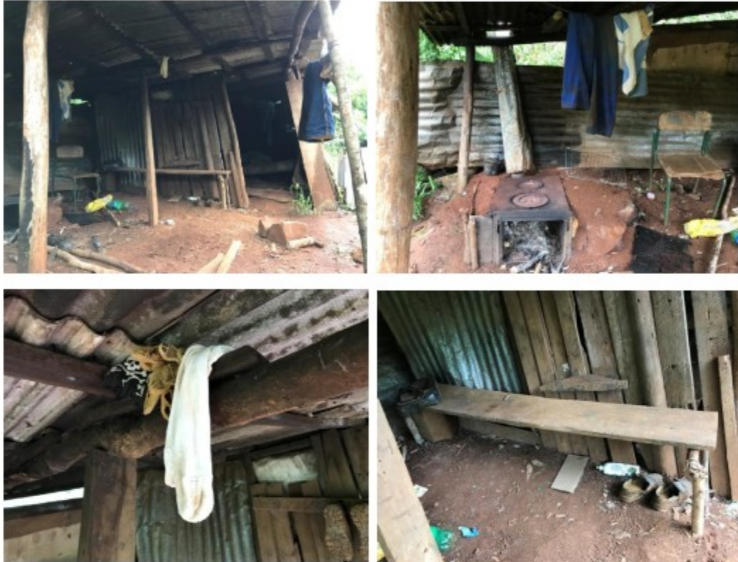
Imagens acima: detalhes da edificação na entrada da pedreira.