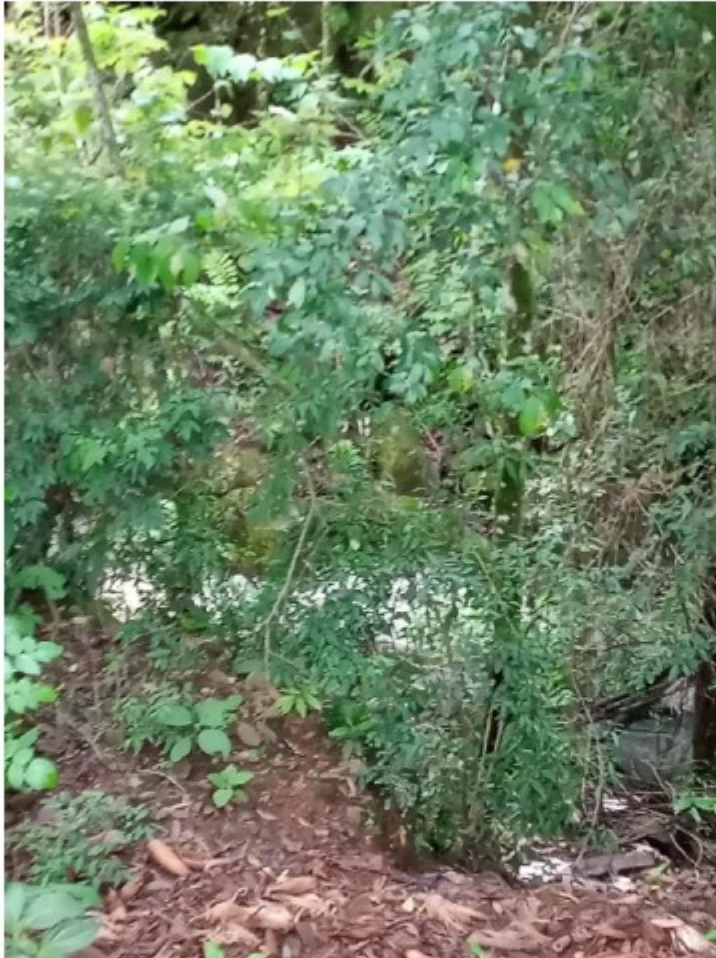
Área ao lado do alojamento, junto do riacho, utilizada como sanitário.

No alojamento ou em qualquer local da área de trabalho não havia instalação sanitária, como consequência o trabalhador utilizava o mato junto do riacho próximo para fazer suas necessidades fisiológicas de defecção, micção e banho frio.