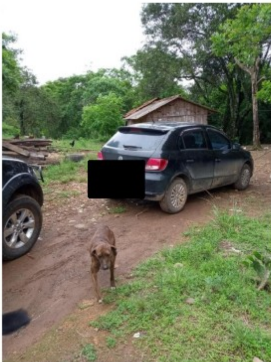
Aspecto do local inspecionado, alojamento e veículo em posse do empregador.

Quando da inspeção o empregador [REDACTED] e o proprietário da área [REDACTED] estavam no local e confirmaram as informações prestadas pelo empregado.