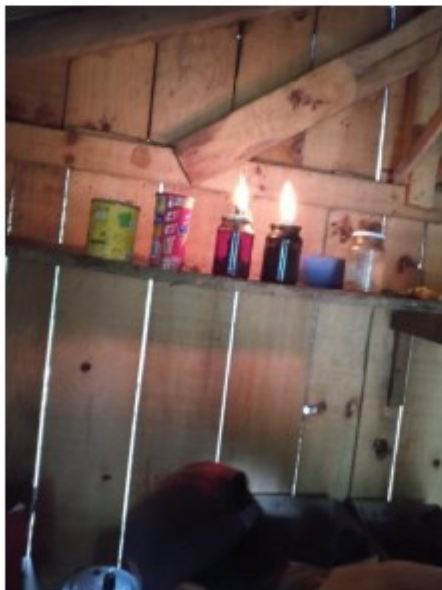
Lamparinas improvisadas com óleo _ausência de energia elétrica