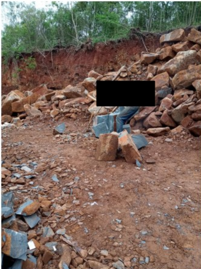
Aspecto da frente de trabalho e atividade do trabalhador resgatado.

de cunhas e marretas passavam toda a jornada operando com grande esforço físico combinado com a exposição às intempéries (sol, chuva, frio). A atividade também acarreta riscos de lesão nas mãos, olhos e pés. Apesar das características da atividade os trabalhadores não receberam óculos de proteção e luvas. O trabalhador resgatado utilizava um sapato aberto na lateral da sola (sapato próprio). Também não contavam com capa de chuva fornecida pelo empregador.