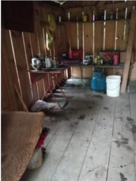
Interior do alojamento_ cozinha sem água encanada, geladeira, etc.