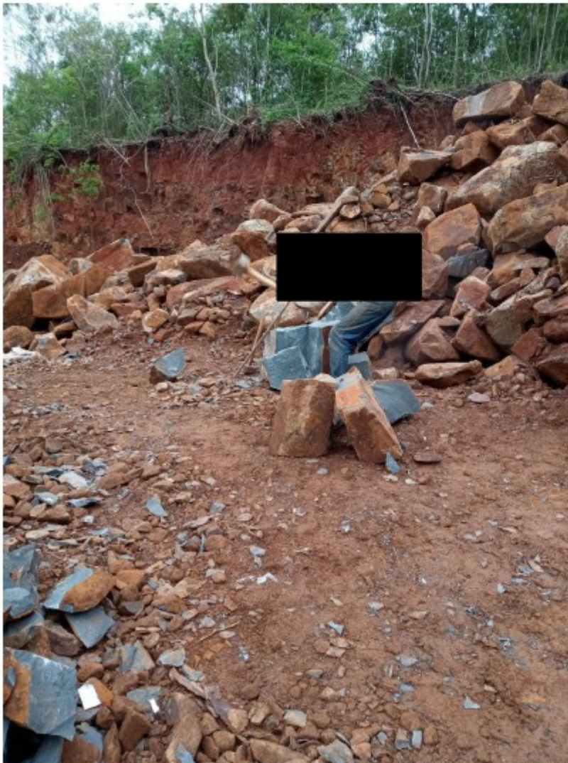
Trabalhador resgatado em atividade.

O empregador opera no corte de pedras, produzindo peças para calçamento viário. Trata-se de atividade manual, sem uso de outras ferramentas que não cunhas e marretas.