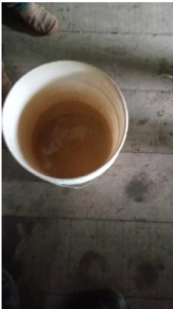
Balde com água coletada no riacho.