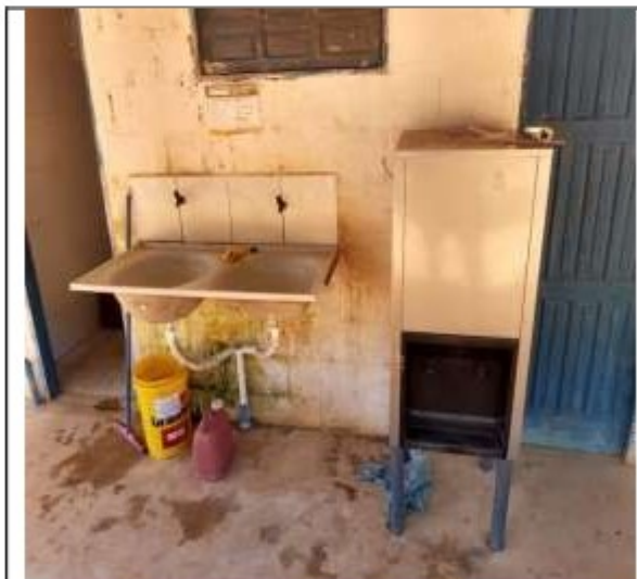
Lavanderia e bebedouro