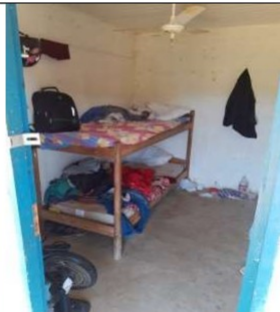
Alojamento dos safristas