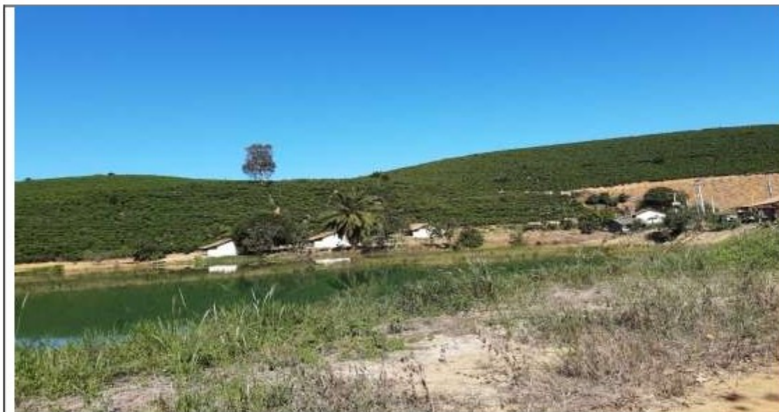
Ao fundo, moradias de empregados fixos e meeiros