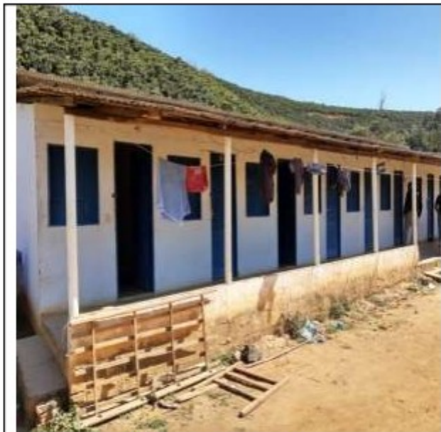
Alojamento dos safristas