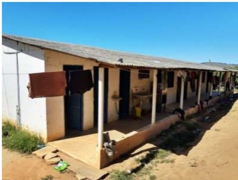
Alojamento dos empregados

PERÍODO DA AÇÃO: 14/07/2020 a 21/07/2020