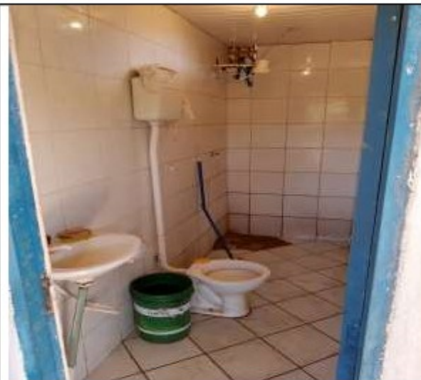
Instalações sanitárias (de um total de três)