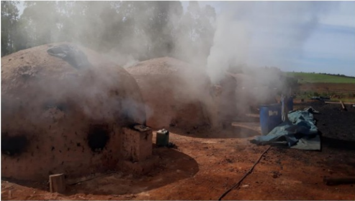
Bateria de Fornos da Fazenda Pastinho – Bambui - MG

A equipe saiu em campo para fiscalização dos locais de trabalho no dia 23 de junho de 2020, sendo que o denunciado principal seria o senhor [REDACTED] e a carvoaria do senhor [REDACTED] também foi citada na denúncia.