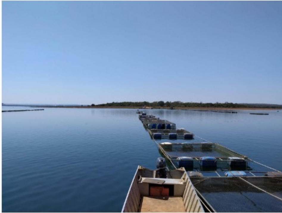
Tanques de criação de tilápias