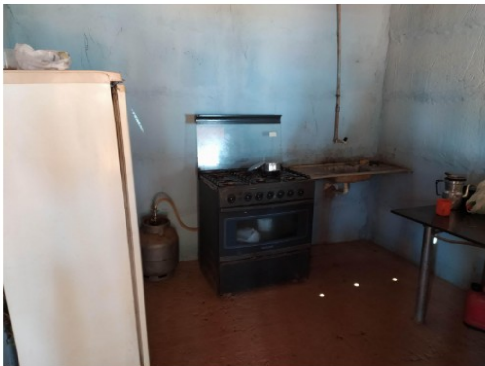
Local com geladeira, fogão e pia