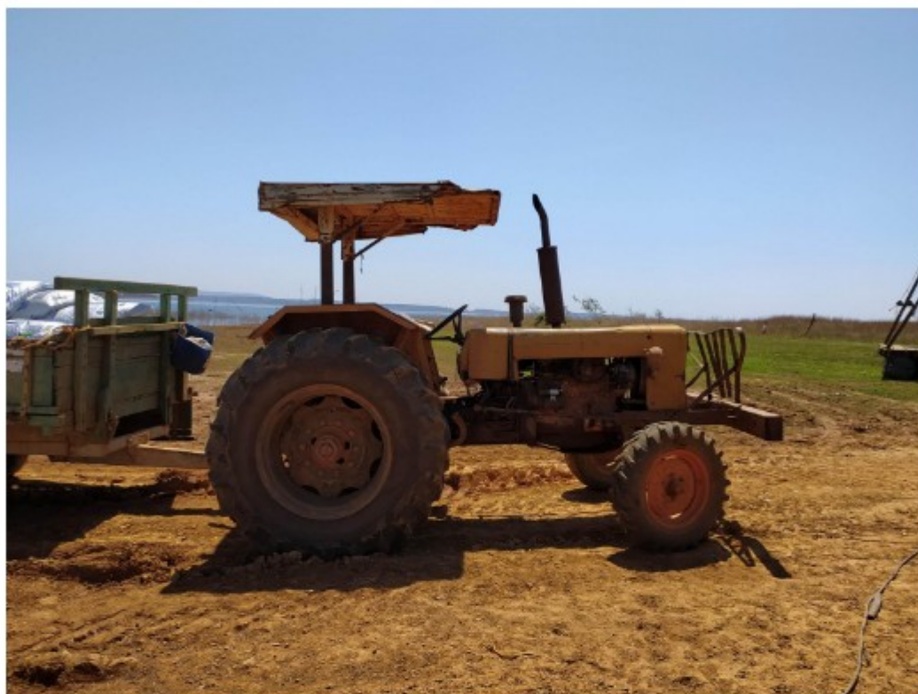
Trator utilizado para puxar pescados e tanques