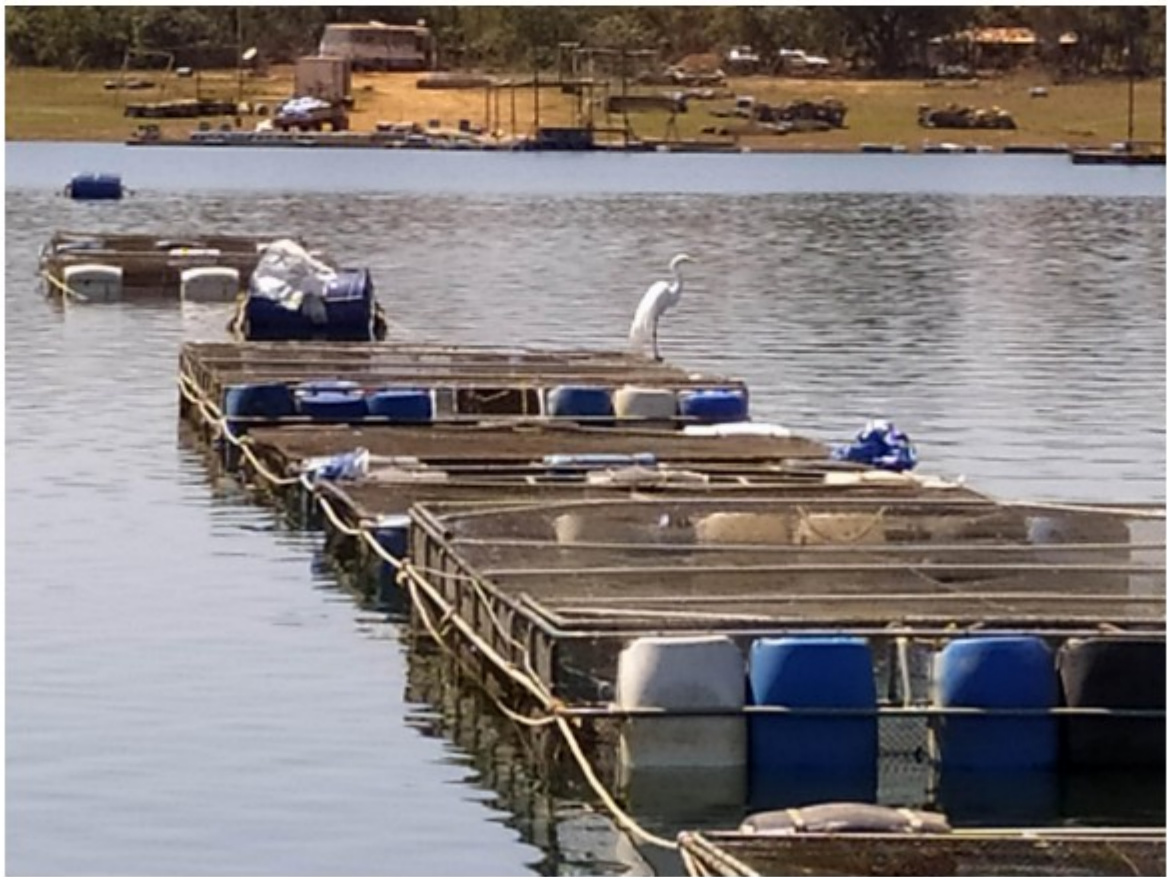
Tanques de tilápia / vista do ancoradouro ao fundo