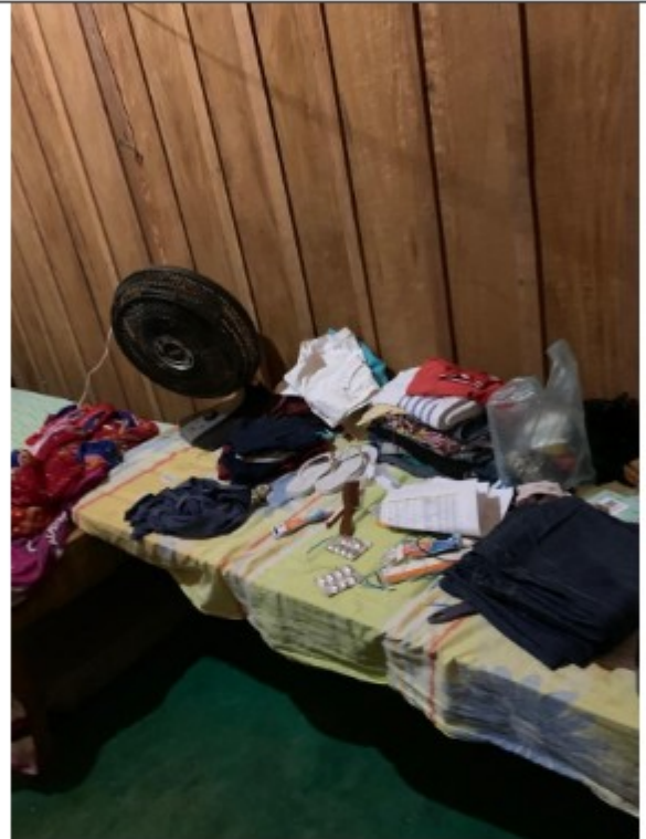
Foto 03, 04 e 05 – Pertences dos trabalhadores espalhados por inexistência de armários