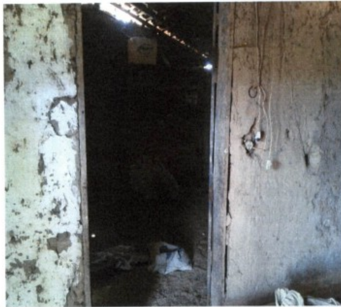
Registro fotográfico exhibe um dos cômodos do alojamento, utilizado como depósito de sacaria e embalagens vazias de agrotóxico.