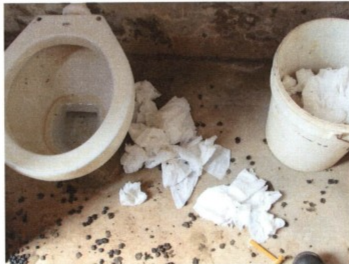
Na imagem vê-se a quantia de papéis servidos jogados no chão da instalação sanitária. É em meio a essa imundice que os obreiros fazem suas necessidades e se banham.

Após entrevista com os trabalhadores e inspeção dos locais de trabalho e alojamento, a equipe de fiscalização entregou notificação ao filho do proprietário, administrador da fazenda, senhor [REDACTED] para que o empregador apresentasse documentação em dia, hora e local determinados.