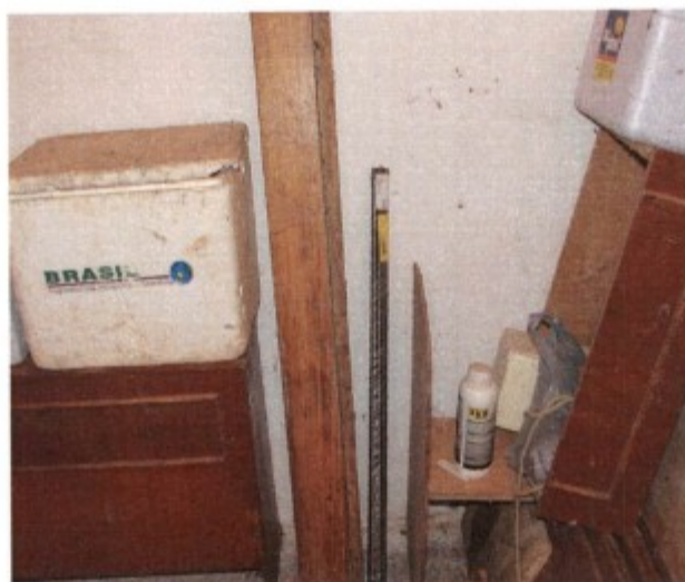
Registro fotográfico exhibe cômodo pertencente à moradia familiar de um casal de trabalhadores e seu filho recém-nascido utilizado como local de armazenamento de agrotóxico.

do agrotóxico permanece diuturnamente aberto, em razão da disposição do cômodo, que obriga a família a transitar várias vezes ao dia pelo espaço para acessar o banheiro da habitação e tampouco é utilizado exclusivamente para o fim de armazenar o produto, uma vez que uma variedade de materiais é depositada no local. A continuidade deste quadro expõe a família residente a sérios agravos à saúde e à integridade física, decorrentes do risco potencial de intoxicação por ingestão, inalação e/ou penetração cutânea do produto, causadas fundamentalmente pelo contato inadvertido e por possível vazamento. Por fim, registre-se que a FISPQ do herbicida GLIFOSATO 480 AKB reconhece entre os possíveis agravos à saúde humana a ocorrência de irritação dérmica, ocular e dano do trato respiratório, bem como adverte que a exposição prolongada ao ingrediente ativo do produto pode provocar danos hepáticos.