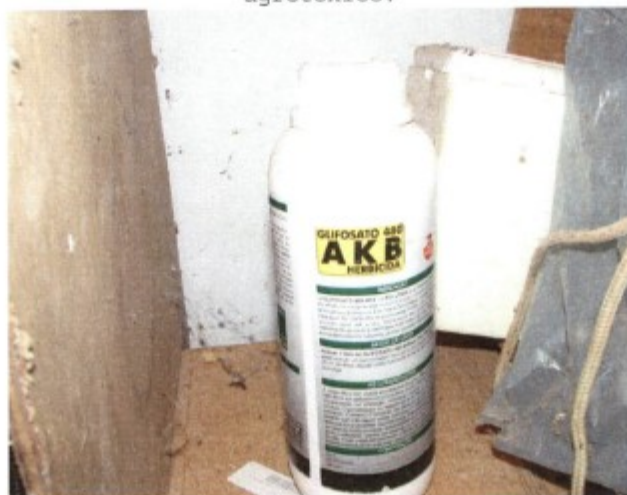
Na imagem vê-se a embalagem do herbicida Glifosato, produto tóxico e perigoso ao meio ambiente, encontrado em meio a outros produtos no interior da moradia de uma família de trabalhadores.