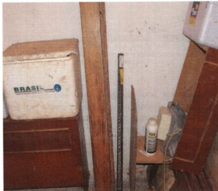
Registro fotográfico mostra peça da moradia familiar servindo à finalidade de depósito de caixas de isopor originalmente usadas para acondicionar medicamento de natureza veterinária, embalagem cheia de agrotóxico, vergalhão e peças cerâmicas de acabamento, dentre outros materiais que a imagem não capturou.