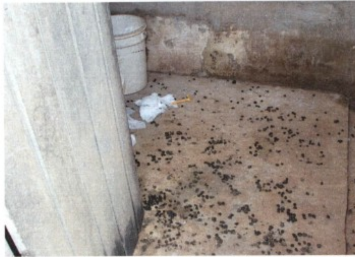
Registro fotográfico exhibe a condição aviltante do banheiro utilizado pelos trabalhadores alojados. O local serve também à evacuação das cabras criadas na propriedade, possível de se notar pela quantidade de fezes espalhadas pelo piso.