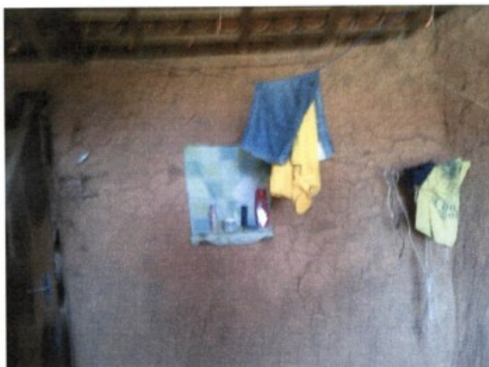
Registro fotográfico exhibe roupas, toalhas e outros pertences de uso pessoal dos trabalhadores pendurados em uma corda no interior de um dos dormitórios do alojamento.

Constatou-se também que o empregador deixou de instalar no alojamento mantido no estabelecimento agrário armários individuais para a guarda de roupas e demais pertences de uso pessoal dos 02 (dois) trabalhadores que coabitavam o local. Dada situação obrigava os obreiros a disporem roupas e outros pertences no chão e/ou pendurados sobre cordas e nas paredes, sonogando-lhes condições adequadas de resguardo da intimidade, expondo-lhes as roupas e demais pertences a sujidades e ao risco de extravios e furtos, e por fim, dificultando-lhes a tarefa de organização e manutenção da higiene e asseio do ambiente.