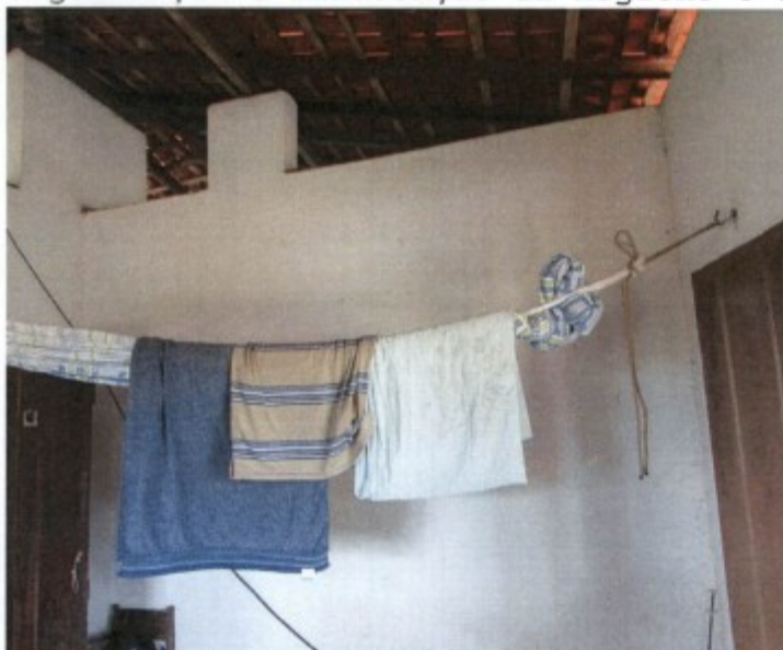
Registro fotográfico exhibe roupas, toalha, lençol e outros pertences de uso pessoal dos trabalhadores pendurados em uma corda no interior de um dos dormitórios do alojamento.

Em inspeção física no ambiente de trabalho e na moradia de 2(dois) dos trabalhadores disponibilizada pelo empregador, constatou-se que o empregador deixou de instalar no alojamento mantido no estabelecimento agrário armários individuais para a guarda de roupas e demais pertences de uso pessoal dos trabalhadores que coabitavam o local. Dada situação obrigava os obreiros a disporem roupas e outros pertences no chão e/ou pendurados sobre cordas e nas paredes, sonogando-lhes condições adequadas de resguardo da intimidade, expondo-lhes as roupas e demais pertences a sujidades e ao risco de extravios e furtos, e por fim, dificultando-lhes a tarefa de organização e manutenção da higiene e asseio do ambiente.