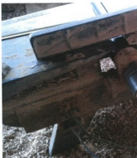
Instalação elétrica de máquina oferecendo risco de choque, incêndio e outros acidentes.