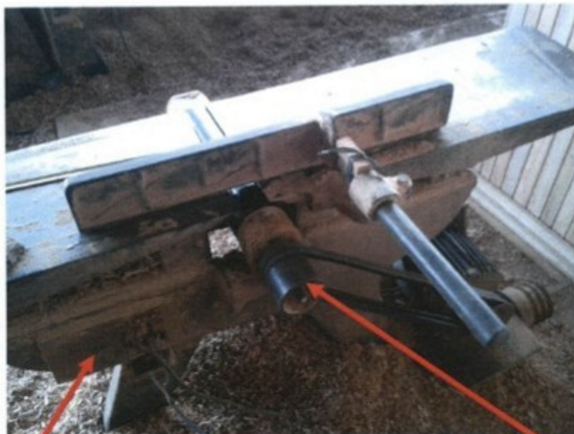
Dispositivo de acionamento, partida e parada localizado em zona perigosa.

No curso da ação fiscal constatou-se que o empregador utilizava máquinas com dispositivos de acionamento e parada instalados e localizados em zonas perigosas, em desrespeito ao item 12.24, alínea "a", da NR-12, com redação da Portaria 197/2010.