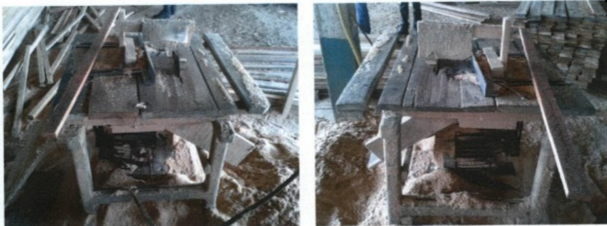
Máquina utilizada na linha de produção, sem dispositivo de parada de emergência.

6.10 - Utilizar máquina com dispositivos de partida e/ou acionamento e/ou parada projetados e/ou selecionados e/ou instalados de modo que se localizem em suas zonas perigosas.