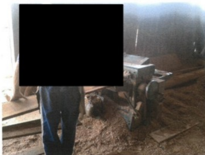
Empregado laborando sem o uso de luvas de proteção

Na inspeção do local de trabalho foram encontrados trabalhadores laborando nas atividades típicas da empresa sem o uso adequado dos equipamentos de proteção individual. Havia empregados sem o uso de protetores auriculares, sem luvas, sem óculos de proteção, trabalhando dentro da madeireira com as máquinas e a madeira, bem como realizando serviços gerais.