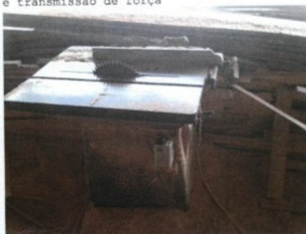
Serra circular sem proteção