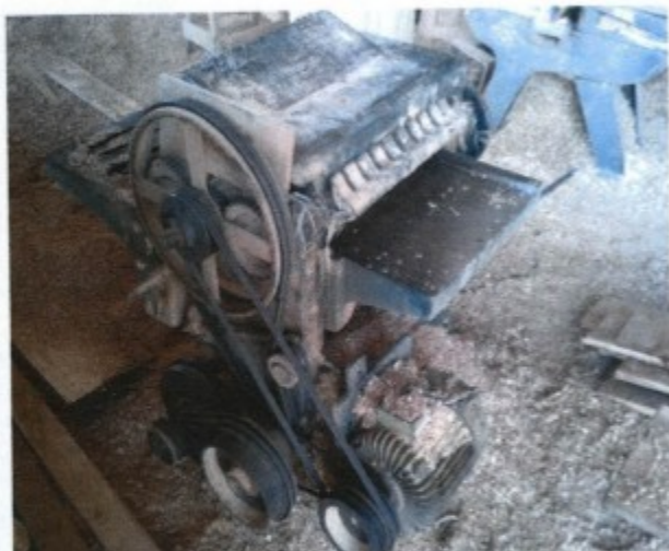
Maquina sem proteção de partes moveis e transmissão de força