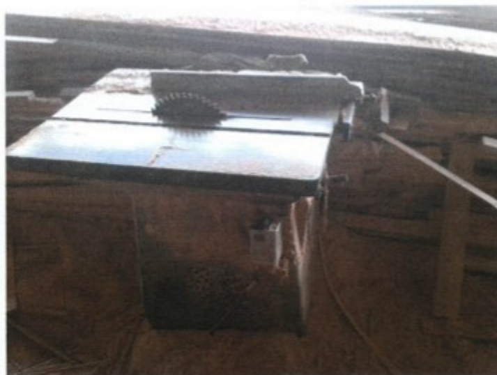
Maquina acionada com chave tipo "lombard"

No curso da ação fiscal constatou-se que o empregador mantinha máquinas em funcionamento, cujo comandos de partida e/ou acionamento não possuíam dispositivos que impedissem o seu funcionamento automático ao serem energizadas, em desrespeito ao item 12.25, da NR-12, com redação da Portaria 197/2010.