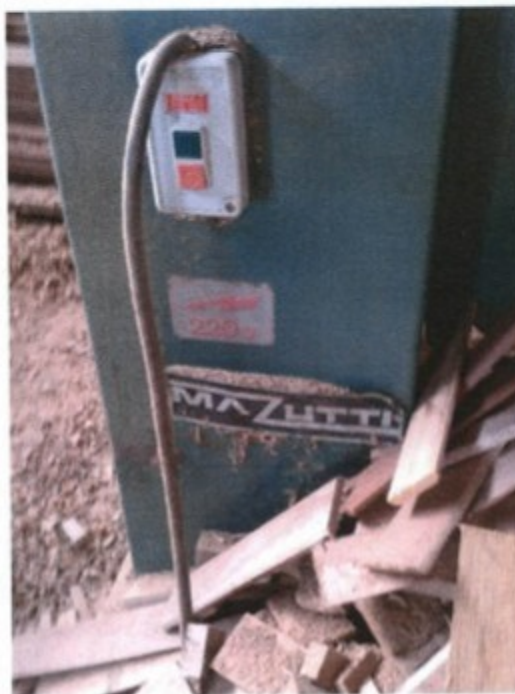
Condutor de alimentação elétrica sem proteção.

No curso da ação fiscal constatou-se que o empregador mantinha condutores de alimentação elétrica de máquinas que não possuíam proteção contra rompimento mecânico, em desrespeito ao item 12.17, alínea "b", da NR-12, com redação da Portaria 197/2010.