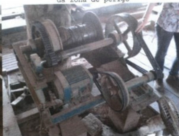
Maquina sem proteção de partes moveis e transmissão de força

Os Auditores Fiscais à vista do Laudo Técnico em anexo, resolveram determinar: