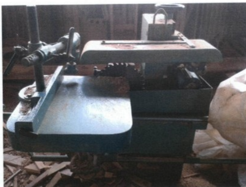
Zonas de perigo de máquina sem sistema de segurança

interdição das referidas máquinas, lavrando-se o respectivo Termo de Interdição (n° 35525920140320-01).