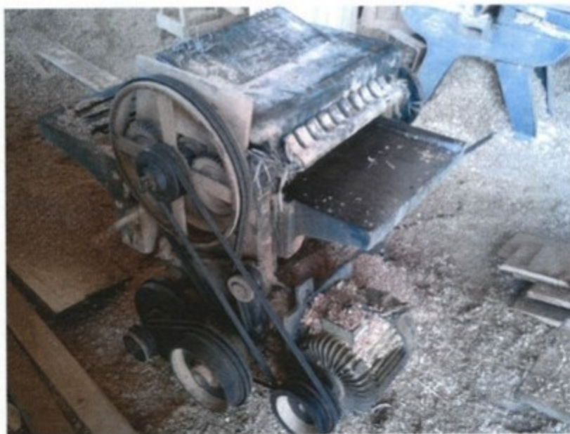
Transmissões de força expostas

Por ocasião da inspeção das máquinas constatou-se a inexistência de proteções fixas ou móveis com dispositivos de intertravamento e que impeçam o acesso por todos os lados nas transmissões de força e componentes a ela interligados das diversas máquinas e equipamentos existentes no aludido ambiente de trabalho. Como exemplo, citam-se o carro transportador de toras e o guincho de toras, que têm motores elétricos com correias expostas e engrenagens sem qualquer proteção, expondo, dessa forma, os trabalhadores a risco de aprisionamento, esmagamento ou amputação de membros. As irregularidades encontradas nesse sentido ensejaram a interdição das referidas máquinas/equipamentos, lavrando-se o respectivo Termo de Interdição (nº 35525920140320-01).