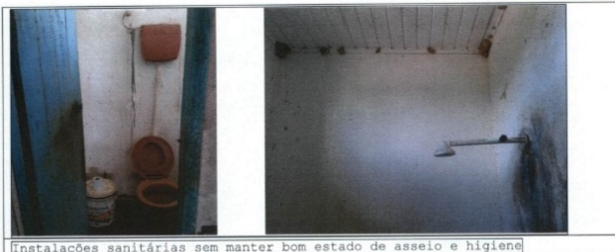
Instalações sanitárias sem manter bom estado de asseio e higiene