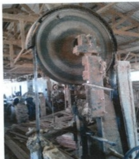
Maquina serra fita sem proteção da zona de perigo