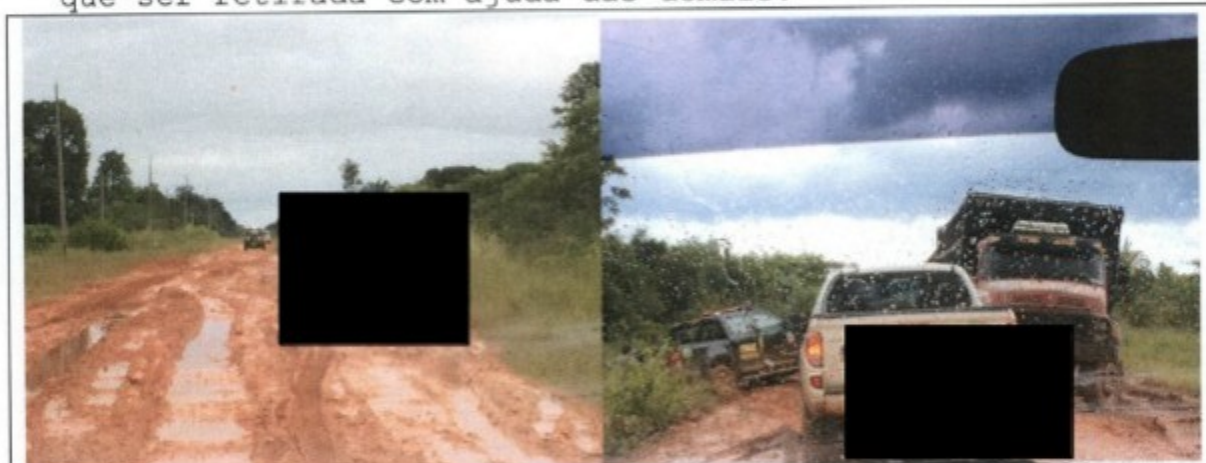
Deslocamento de Humaitá a Comunidade Realidade

Assim foi feito. No dia 19 de março foi empreendida viagem até a Comunidade de Realidade, um distrito de Humaitá. No caminho já descobrimos que realmente as vicinais deveriam estar intransitáveis, pois a estrada que leva ao distrito, a BR-319 (rodovia que leva a Manaus) já apresentava vários pedaços na parte sem asfalto em que as viaturas já tiveram dificuldade, inclusive uma da Força Nacional atolou e teve que ser retirada com ajuda das demais.