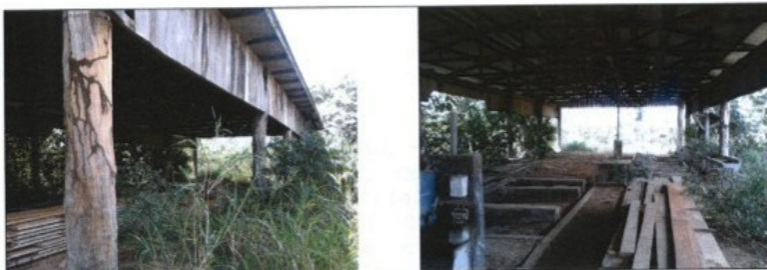
Fotos cedidas pelo IBAMA do local onde já existiu a Madeireira Realidade