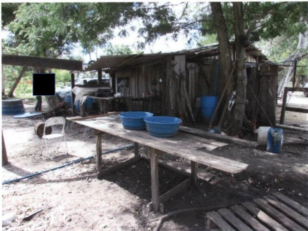
Local utilizado para lavar roupas