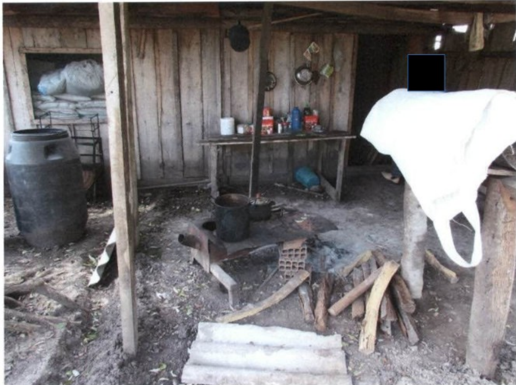
Fogareiro improvisado para o preparo de alimentos