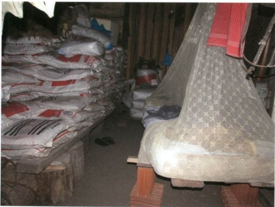
Interior do barraco utilizado como alojamento, com piso de terra, sal para gado estocado e "tarimbas" improvisada para o descanso noturno

A seguir, algumas fotos tiradas no local ilustram as irregularidades descritas: