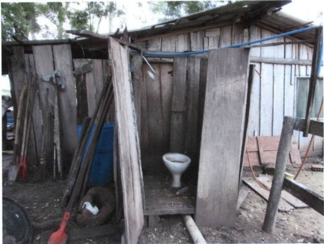
Local com vaso sanitário na parte externa do barraco, sem água, sem porta e sem qualquer condição de uso. À direita, local utilizado para tomar banho, com uma mangueira pendurada, totalmente exposto