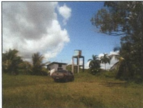
Fotos: Represa de onde a água era captada e caixa onde era armazenada antes do consumo.

No refeitório inspecionado, havia tão somente um filtro de barro de uso doméstico, cujas três velas asseguram tão somente a retenção de partículas ou outros elementos de maiores dimensões, sendo ineficaz para garantia de potabilidade da água.