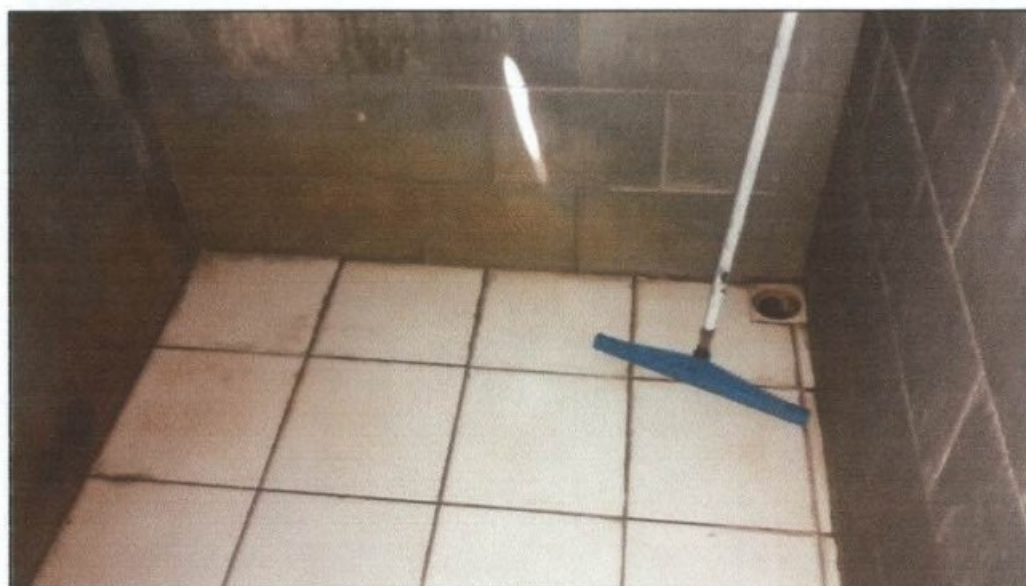
Fotos: Instalações sanitárias do alojamento.