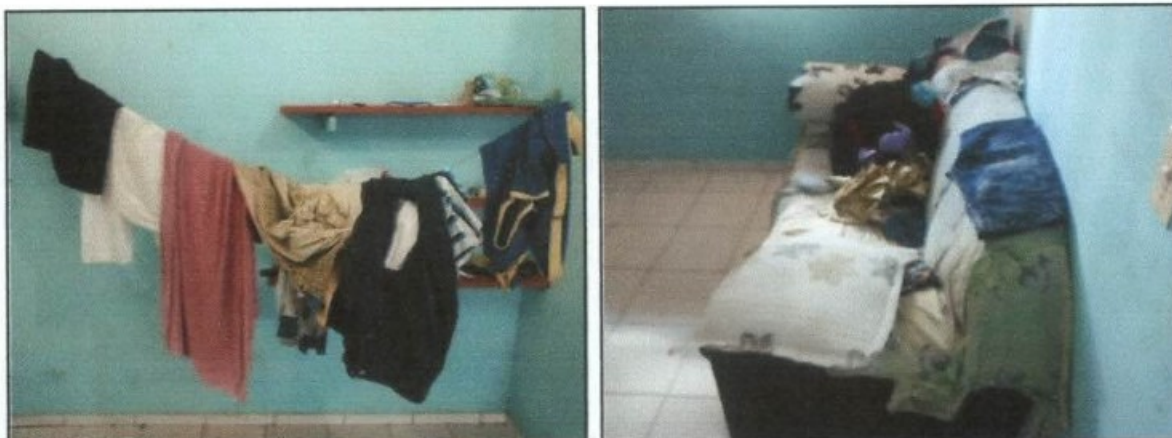
Fotos: Pertences dos trabalhadores espalhados pelo alojamento.

pertences espalhados desordenadamente pelos cômodos, diretamente ao chão, pendurados nas paredes, dentro de sacolas e em cima das redes lá existentes.