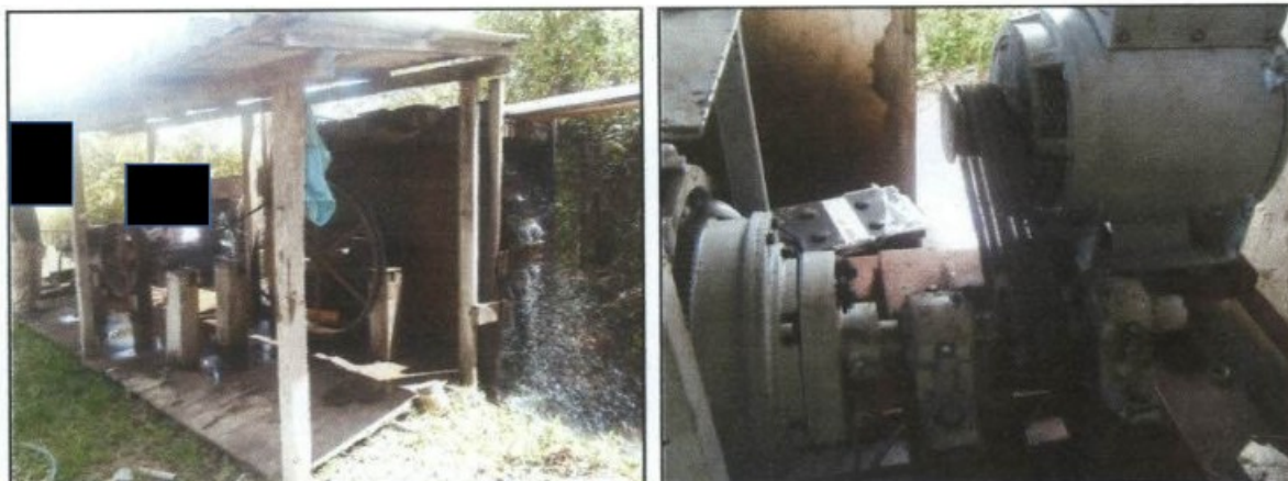
Fotos: Transmissões de força das máquinas expostas.

de cor vermelha, sem marca nem modelo definidos, que estava com a transmissão de força sem proteção.