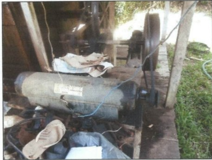
Foto: Instalações elétricas do local onde ficava a roda d'água.

As instalações elétricas dos locais acima descritos eram precárias, feitas na forma de gambiarras, com a fiação e emendas expostas, passando de maneira desordenada e improvisada, expondo os trabalhadores ao risco de choque elétrico por contato acidental com os fios e emendas energizadas e expostas. Além disso, a edificação que abriga a roda d'água era constituída de madeira e sob ela estão diversos materiais considerados de fácil combustão (papel, papelão, chinelo, borracha, saco plástico etc.); enquanto na outra edificação o motor gerador de energia também tinha diversos materiais considerados de fácil combustão (papel, palha seca, borracha, combustível etc.).