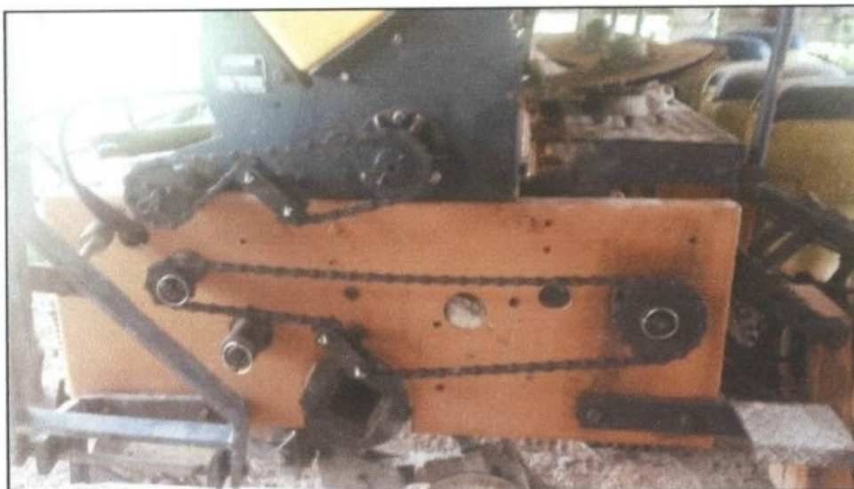
Fotos: Zonas de perigo das máquinas expostas.