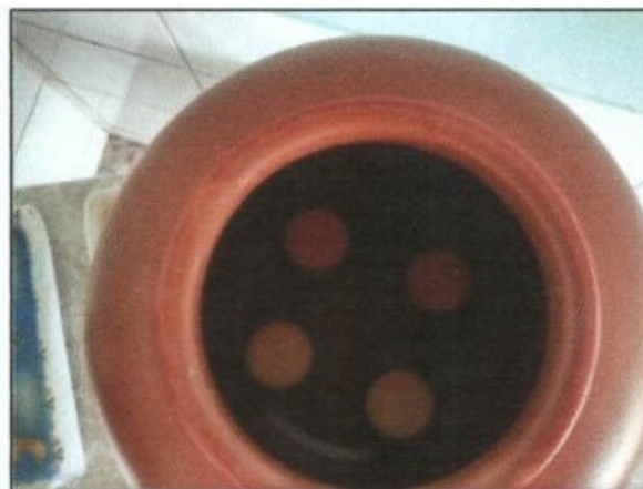
Fotos: Filtro de cerâmica que filtrava a água a ser consumida pelos trabalhadores.