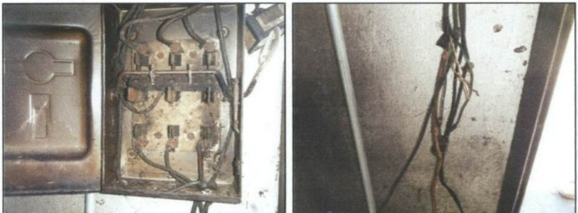
Fotos: Fiações elétricas com partes vivas expostas e sem proteção.

As instalações elétricas dos locais acima descritos eram precárias, feitas na forma de gambiarras, com a fiação e emendas expostas, passando de maneira desordenada e improvisada, expondo os trabalhadores ao risco de choque elétrico por contato acidental com os fios e emendas energizadas e expostas. Além disso, a edificação que abriga a roda d'água era constituída de madeira e sob ela estão diversos materiais considerados de fácil combustão (papel, papelão, chinelo, borracha, saco plástico etc.); enquanto na outra edificação o motor gerador de energia também tinha diversos materiais considerados de fácil combustão (papel, palha seca, borracha, combustível etc.).