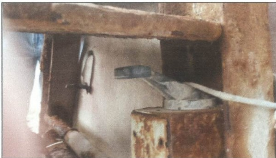
Foto: Chave Lombard utilizada para ligar a betoneira.

Havia no antigo local dos estábulos/curral dos bois, uma betoneira improvisada, de cor vermelha, sem marca nem modelo definidos, que tinha como dispositivo de partida, acionamento e parada uma chave Lombard, cujo uso nesse equipamento acaba acrescentando o risco de acionamento ou desligamento involuntário/ acidental. Ainda, esse tipo de chave não impede o funcionamento automático da máquina ao ser energizada.