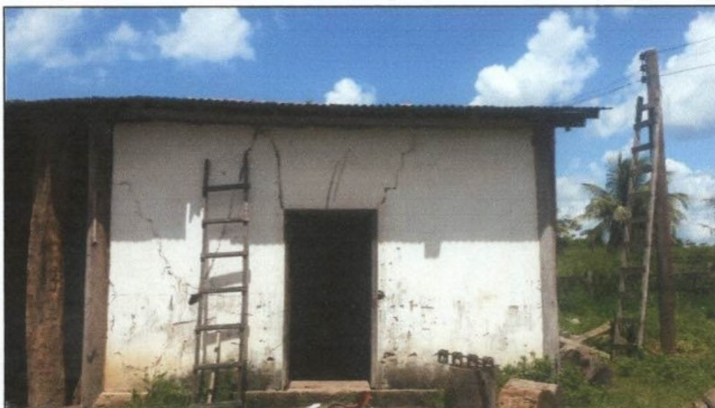
Foto: Depósito onde eram armazenados os agrotóxicos.

Os trabalhadores faziam uso de diversos agrotóxicos na Fazenda, dentre os quais podem ser citados: PLENUM (Classe: Herbicida Seletivo E Sistêmico, Grupo Químico: Ácido Piridiniloxialcanóico (Fluroxipir) e Ácido Piridinocarboxílico (Picloram); STANDAK TOP (Uso: Agrotóxico, Inseticida; Ingredientes Perigosos: Fipronil, Thiophanate-Methyl, Piraclostrobin E Ingredientes Inertes); JOINT OIL (Classe: Adjuvante; Grupo Químico: Hidrocarbonetos); GLIF-ALL (Classe: Pesticida, Líquido, Tóxico, Princípio Ativo: Glifosato, Classe Ou Subclasse De Risco: 6.1); dentre outros.