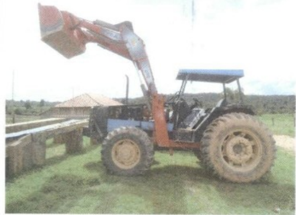
Foto: Máquina autopropelida empregados sede