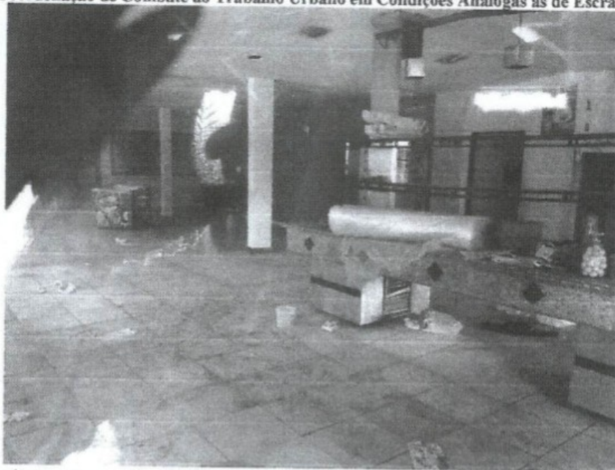
Geladeira de sorvetes e alguns objetos no estabelecimento, evidenciando inatividade laboral