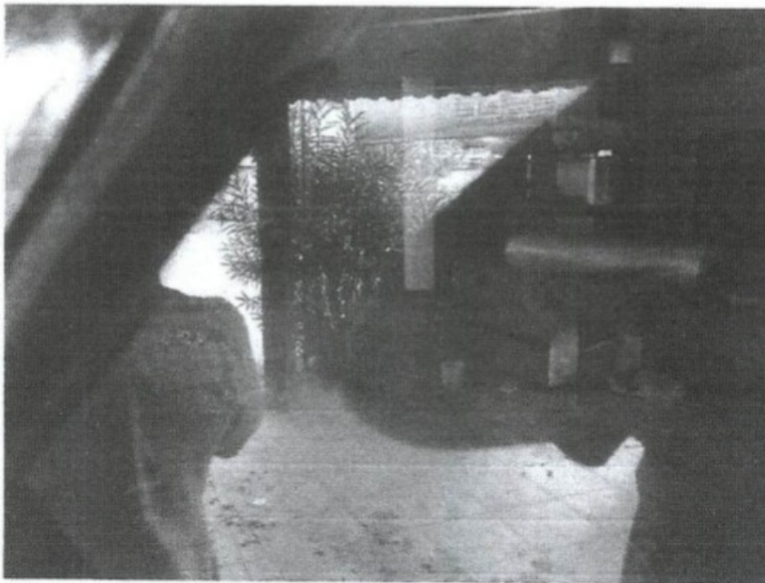
Através do vidro, observou-se piso sujo e alguns objetos deixados pelo salão do restaurante

Abaixo, seguem fotos do estabelecimento fechado: