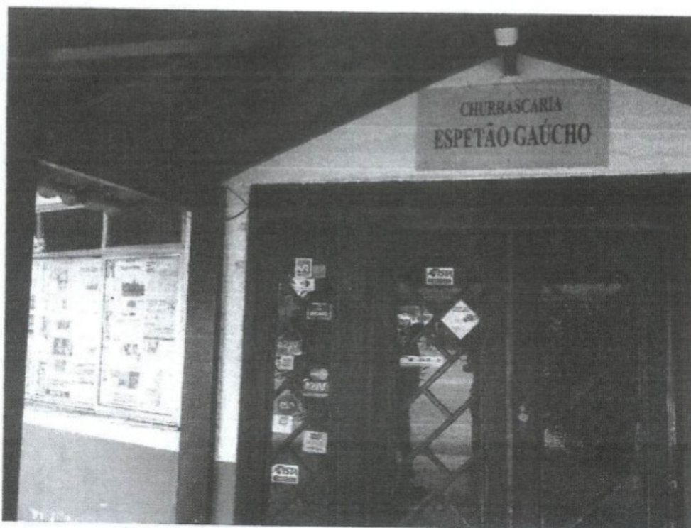
Entrada do estabelecimento, com jornais nas janelas