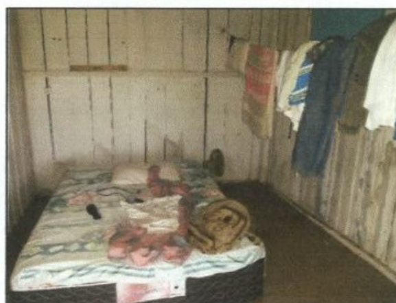
Fotos: Interior de um dos quartos do alojamento ocupado pelos trabalhadores da Fazenda.