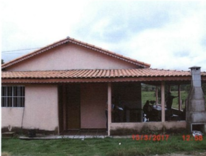
Sede da fazenda.

Em ação fiscal do Grupo Especial de Combate ao Trabalho Escravo - GEFM, constituído por Auditores Fiscais do Ministério do Trabalho, Procuradora do Ministério Público do Trabalho, Defensor Público Federal e Policiais Federais, iniciada em 15/03/2017, e em curso até a presente data, na Fazenda Paraíso do Sul, CEI [REDACTED], situada no ramal garimpim, zona rural de Cumaru do Norte-PA, nas coordenadas geográficas 9°30'21.84"S e 51° 9'26.64"O, constatou-se 2(dois) trabalhadores exercendo a função de vaqueiro e gerente.