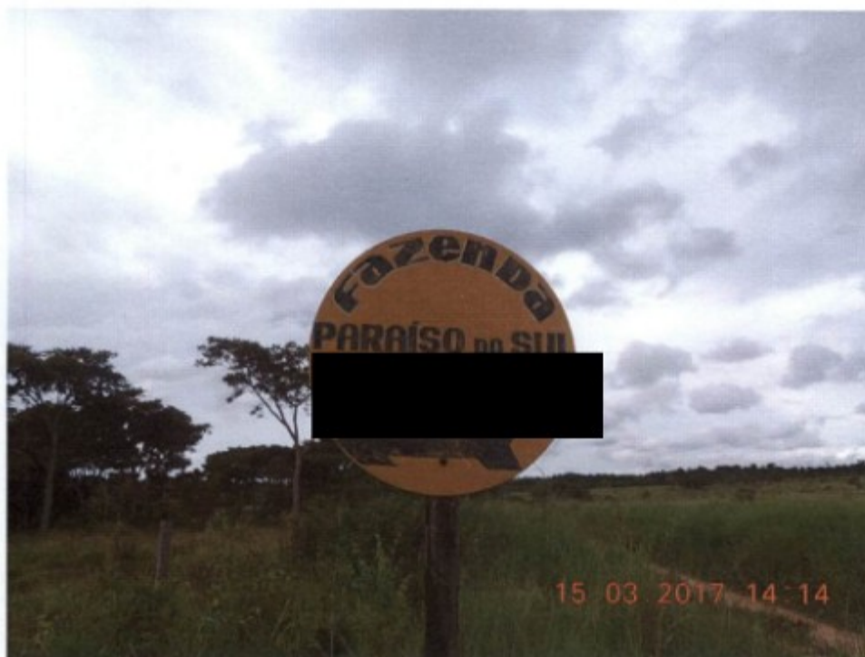
FAZENDA PARAÍSO DO SUL

PERÍODO: 14/03/2017 À 24/03/2017 LOCAL: CUMARU DO NORTE-PA ATIVIDADE: 0151-2/01 CRIAÇÃO DE BOVINOS PARA CORTE COORDENADAS GEOGRÁFICAS: 9°30'21.84"S E 51° 9'26.64"O OPERAÇÃO: 011/2017 SISACTE: 2400-2016