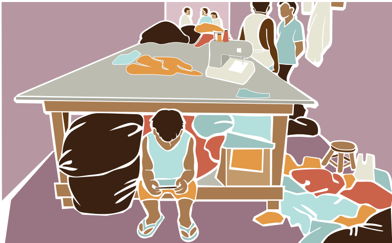
Muchas veces la inspección de trabajo encuentra niños dentro de los talleres de costura.

Ocurre cuando el trabajador se ve obligado a permanecer en un puesto de trabajo donde lo están explotando. El empleador utiliza diversos medios para mantener al trabajador bajo su control, como la retención de salarios y/o documentos e incluso violencia, abuso y amenazas físicas y psicológicas, como la denuncia a las autoridades migratorias en el caso de migrantes indocumentados.