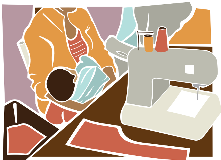
Madre trabajadora con su bebé en el puesto de trabajo (taller de costura).