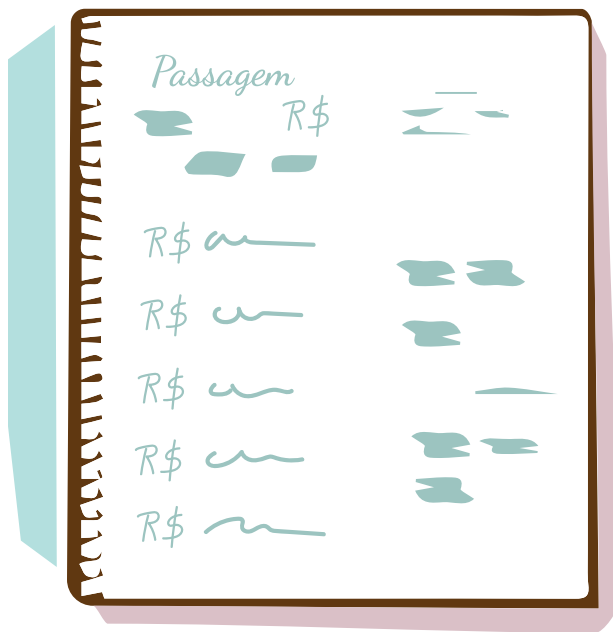
Exemplo de anotações de gastos cobrados ilegalmente como dívidas dos trabalhadores.