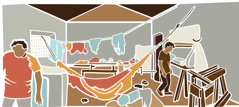
Trabalhadores escravizados em alojamentos precários.

Caso o trabalhador tenha vindo para o Brasil convencido por promessas enganosas, se os salários não estão sendo pagos corretamente e as condições de trabalho são degradantes, ele pode procurar ajuda das autoridades brasileiras, mesmo que a situação documental no país não esteja regularizada.