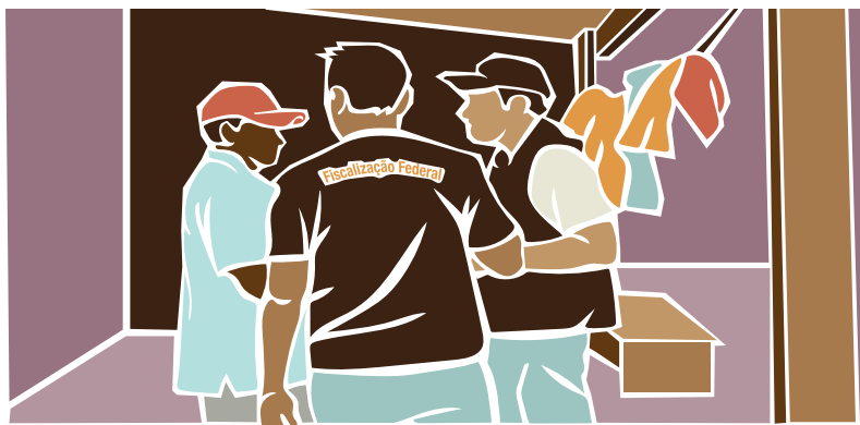
Auditores-Fiscais do Trabalho fiscalizam as condições de trabalho de migrantes e refugiados no Brasil.

Serviço telefônico do Ministério da Mulher, da Família e dos Direitos Humanos que recebe denúncias de violação de direitos humanos.