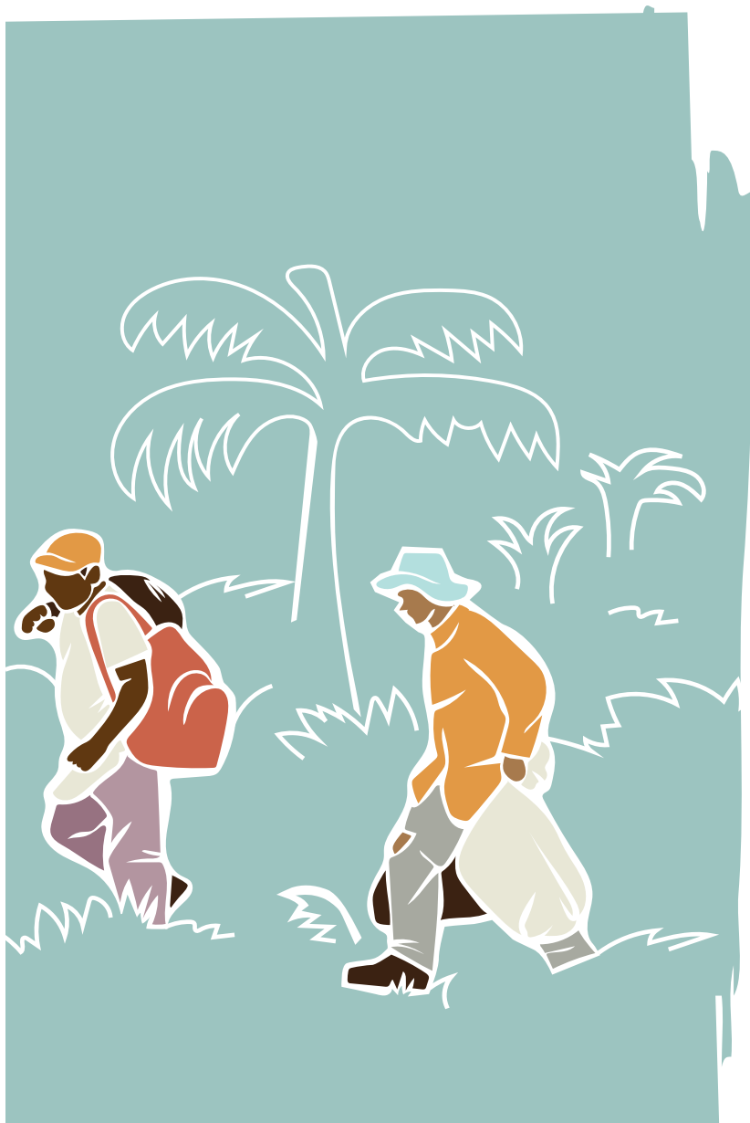
Trabalhadores escravizados em fazendas no Brasil.