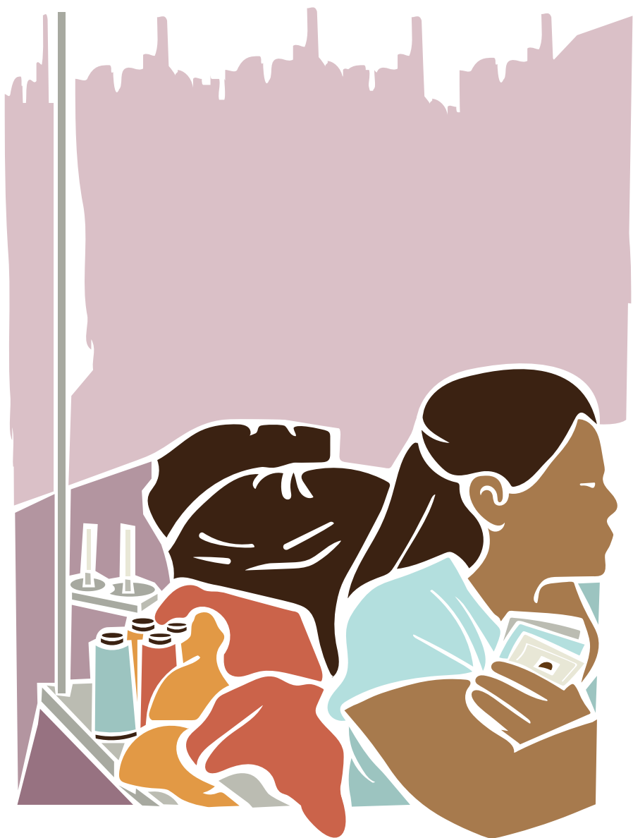
Trabalhadora migrante sem os documentos migratórios regulares em atividade nas oficinas de costura.