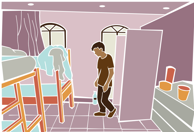
Trabalhador migrante resgatado pela fiscalização do trabalho em oficina de costura.

A escravidão contemporânea 1 existe em praticamente todos os países do mundo. No Brasil, apesar da proibição por lei, essa é uma realidade que afeta alguns trabalhadores tanto no campo quanto nas grandes cidades, sendo parte deles migrantes e refugiados.