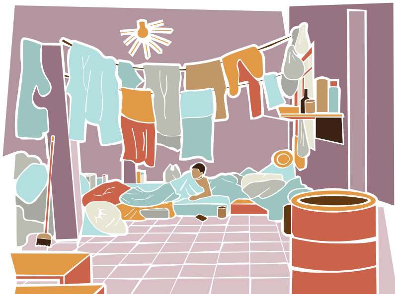
Local inadequado para alojar trabalhadores.