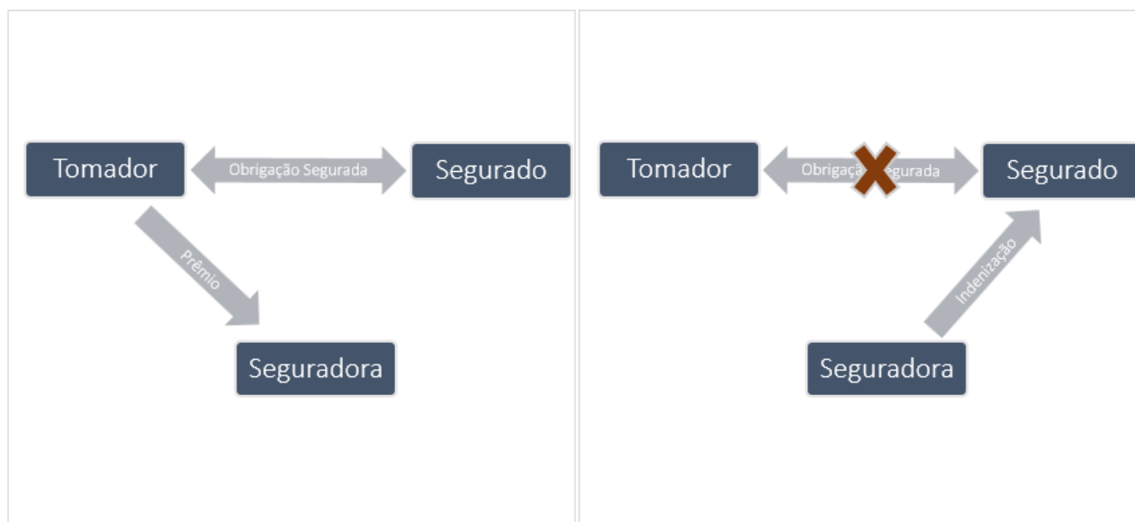
Figura 1 – Contratação

No decorrer da vigência do contrato de seguro, caso confirmado o descumprimento 11 , pelo tomador, das obrigações garantidas pela apólice, a seguradora deverá pagar ao segurado a indenização devida, na forma acordada entre as partes 12 . (Figura 2)