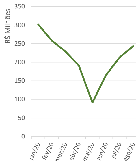
Gráfico 2 Prêmios | Garantia Estendida