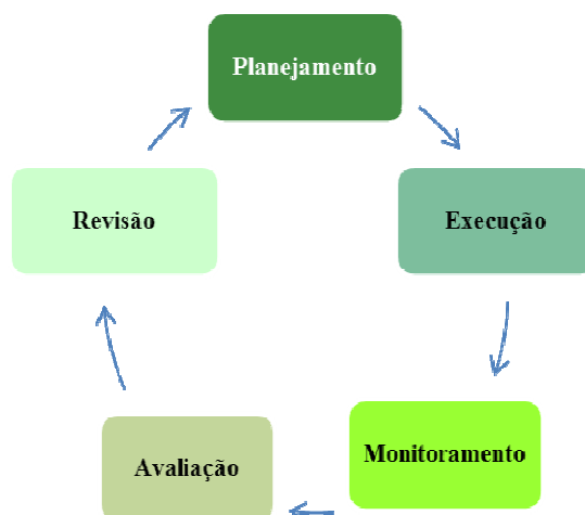
Figura 1 – Ciclo de gestão do planejamento estratégico da SUDENE

Posto isto, a Missão da Autarquia assim está definida: