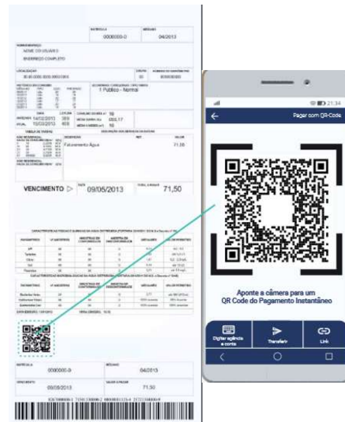
Arrecadação de tributos