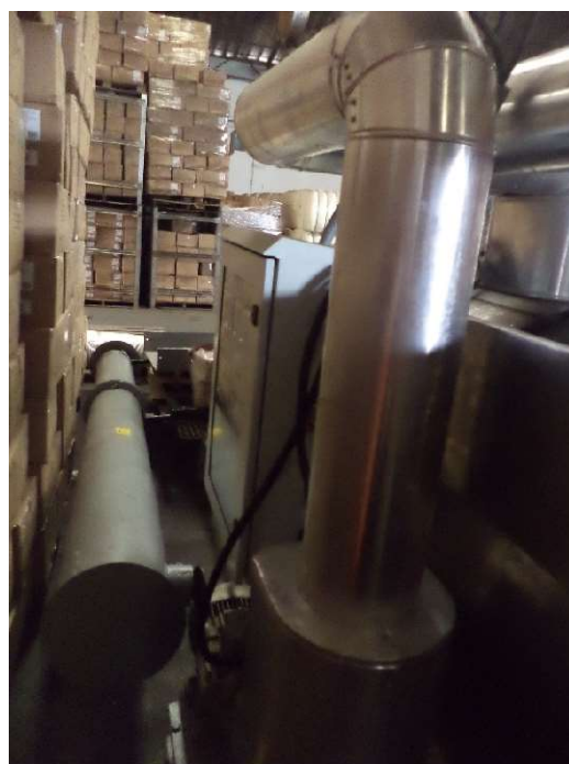
Caldeira - Painel de Controle e Chaminé