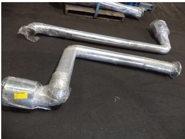
Caldeira – Tubos de ligação