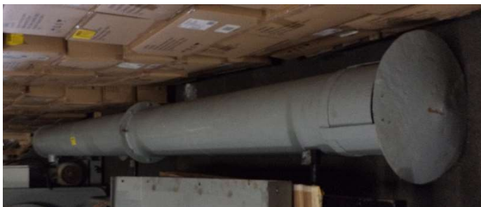
Caldeira – Chaminé