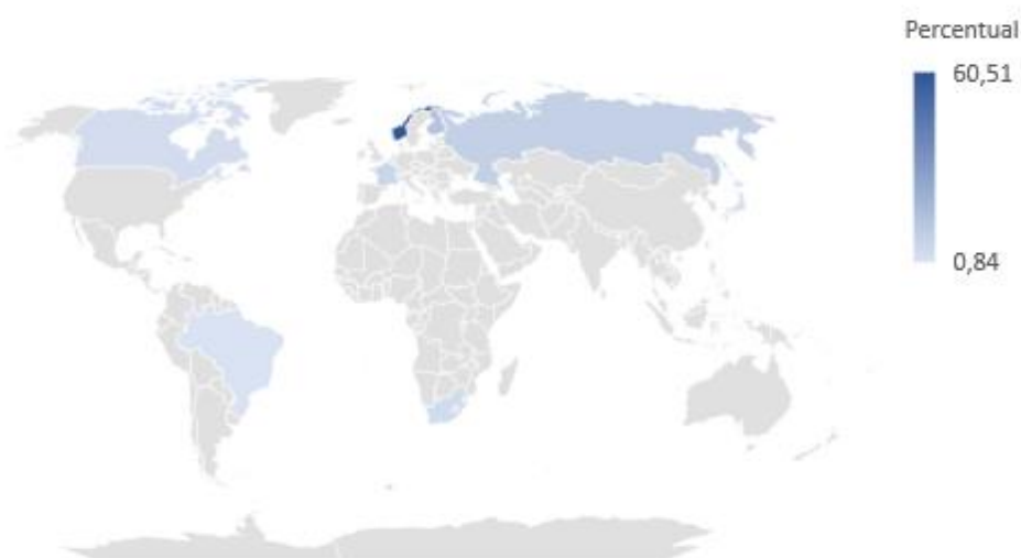
Consumo da cota por país de origem

No período, verificaram-se importações intracota originárias de 8 países. A Noruega responde por grande parte do montante consumido, com 60% das importações.