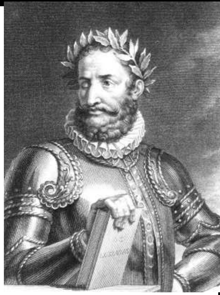
Luís Vaz de Camões

“Não se aprende, senhor, na fantasia, sonhando, imaginando ou estudando, senão vendo, tratando e pelejando.”