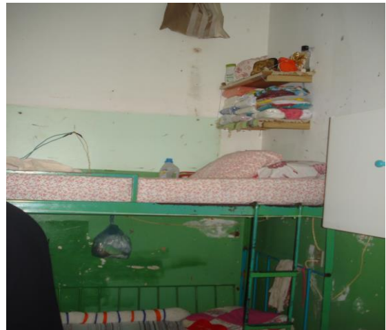
Interior da Cella do Berçário