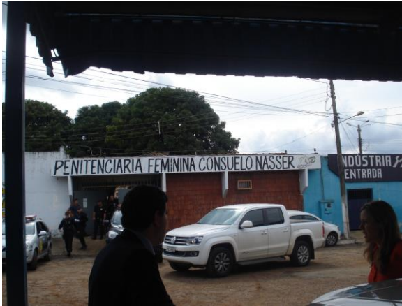
Entrada da Unidade Prisional