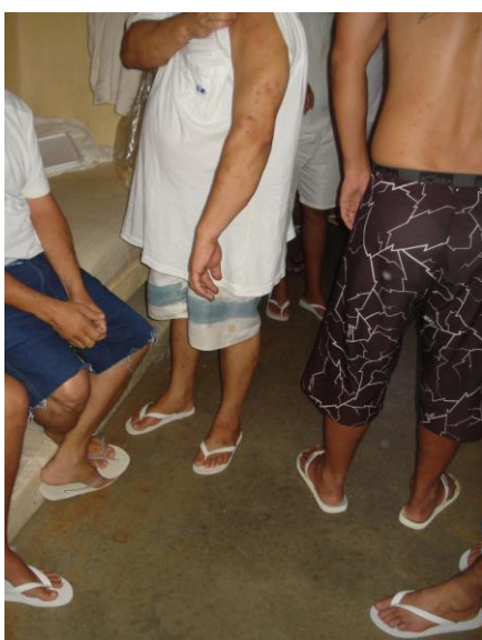
Ataque de Percevejo