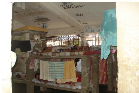
Cela da Casa do Albergado