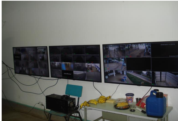
Sala de Monitoramento