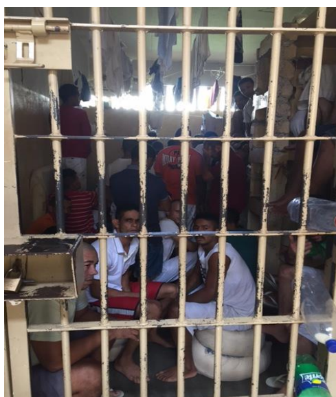
Celas superlotadas com pessoas no corredor