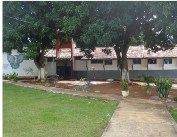
Interior da Unidade Prisional