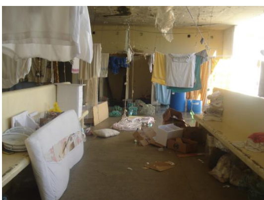
Pátio de uma Ala