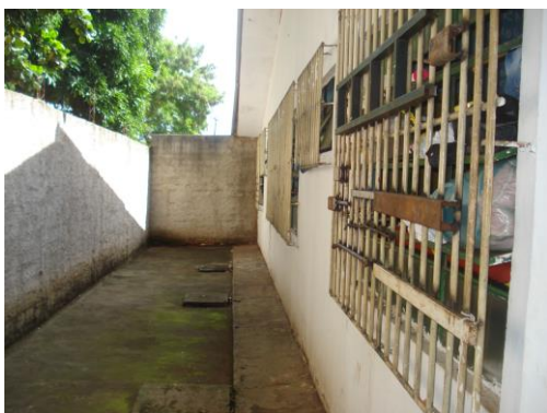
Lateral da casa do albergado