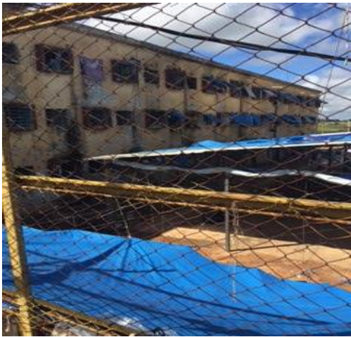
Ala em funcionamento com pátio (POG)