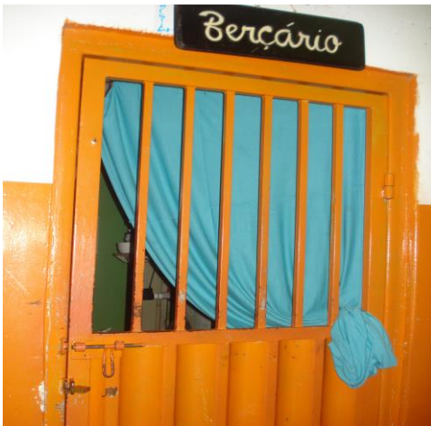
Berçário com cadeado