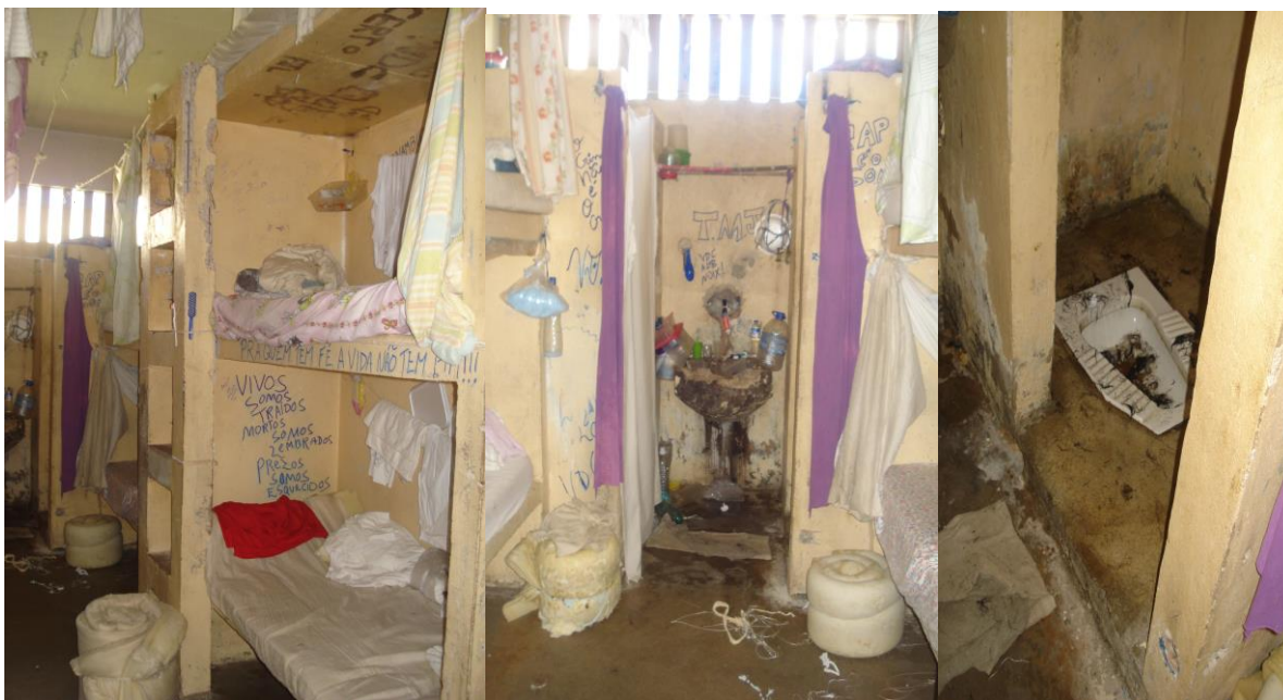
Cela (Central Regional de Triagem)