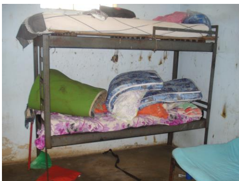
Cela da Casa do Albergado