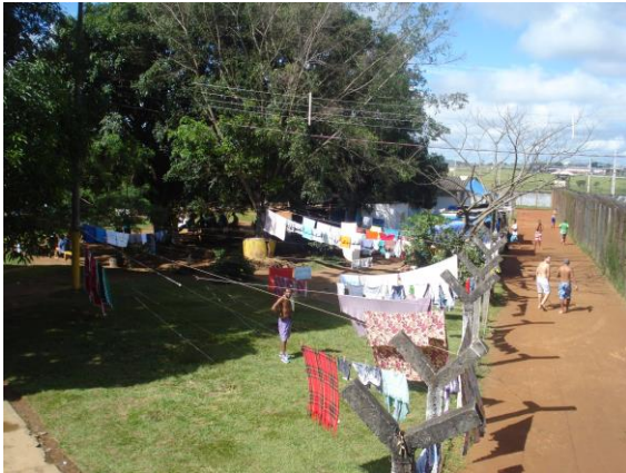
Pátio do Banho de Sol (POG)