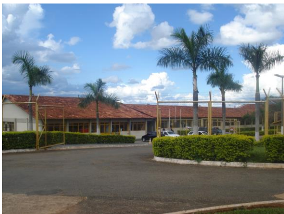
Entrada da CPP