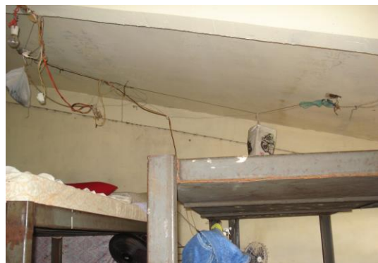
Sistema elétrico da casa do albergado