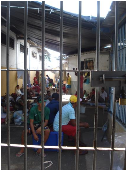
Pátio da ala