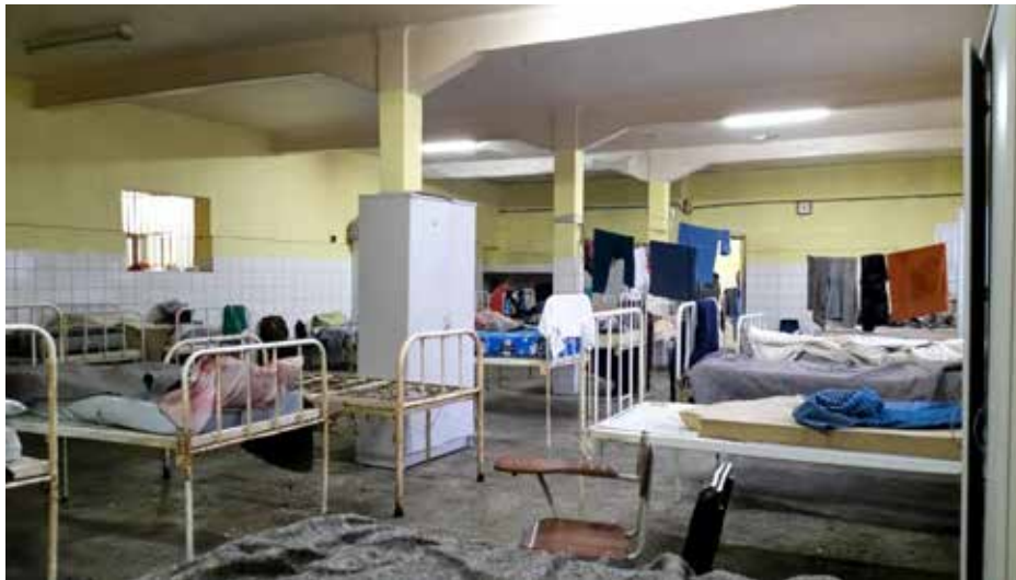
Leitos de instituição psiquiátrica no Rio Grande do Sul.

207. No caso das mulheres internadas no HCTP I de Franco da Rocha, em São Paulo, foi possível notar a realização de atividades pautadas por estereótipos de gênero , como oficinas de manicure e costura. Tais atividades reforçavam papéis sociais rígidos, como se as mulheres apenas se interessassem por tarefas ligadas ao âmbito doméstico, o que poderia não corresponder aos anseios dessas pessoas.