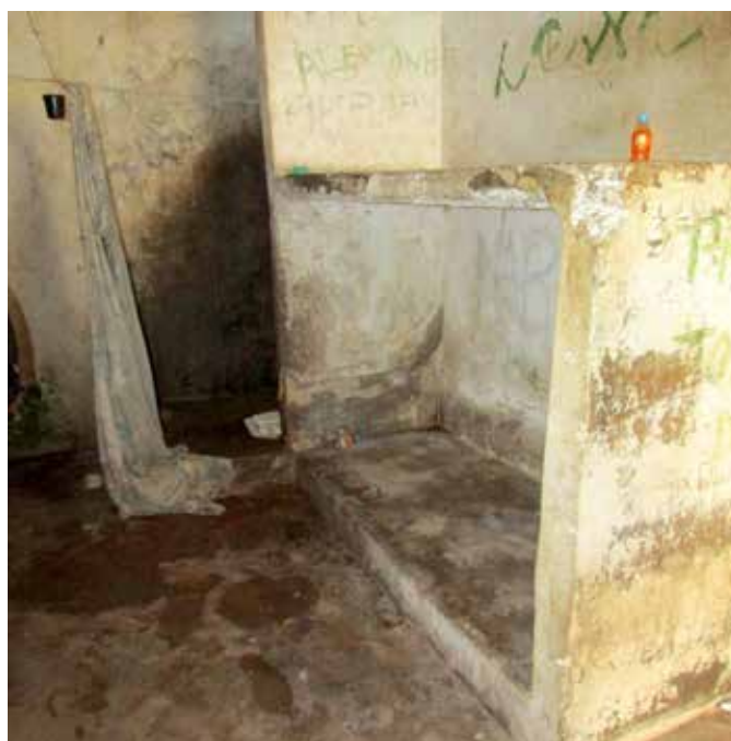
Cela de isolamento de unidade do Complexo Penitenciário de Pedrinhas, no Maranhão.

89. Quando existentes, os Regimentos Internos não eram divulgados aos presos, de modo que eles sequer sabiam sobre a existência desta norma interna. Ainda, outro problema bastante observado pelo MNPCT se referiu à falta de registros dos procedimentos disciplinares internos. No Maranhão, por exemplo, havia apenas algumas portarias de abertura de procedimento, mas nenhum de fato concluído. Quando os registros eram realizados, os procedimentos estavam precariamente relatados, não expondo quais trâmites foram adotados.