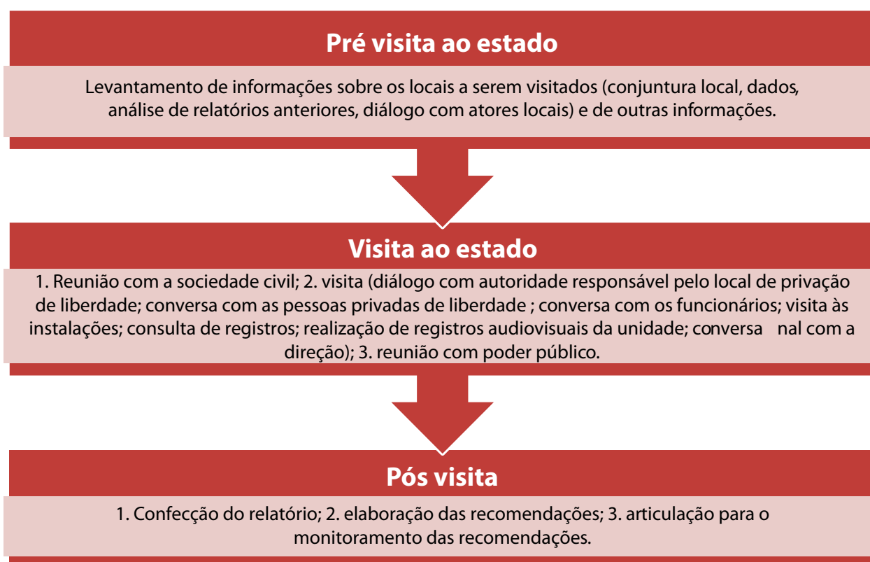
Figura 2: Atividades do MNPCT para a realização das visitas aos locais de privação de liberdade

48. Na Figura 2, encontra-se sistematizado o modo como as ações do MNPCT se dividem no processo de preparação de visitas, nas visitas e na elaboração dos relatórios e das recomendações: