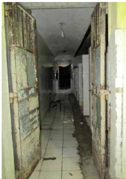
Unidade prisional feminina em São Paulo.

114. A situação das mulheres nesse cenário era ainda mais grave, pois a arquitetura prisional não levava em consideração as especificidades delas, conforme preconizado nas Regras de Bangkok e na Política Nacional de Atenção às Mulheres em Situação de Privação de Liberdade e Egressas do Sistema Prisional (PNAMPE) 40 . Geralmente, os cárceres femininos eram unidades masculinas que não serviam mais aos homens, devido às suas condições infraestruturais precárias. Depois de desativados, as mulheres foram alocadas nesses espaços, sem qualquer tipo de readequação. Este seria o caso, por exemplo, da Penitenciária Feminina de Sant'ana, em São Paulo.