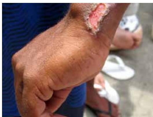
Lesão provocada no momento da detenção, no Amazonas.

107. Em ambos os casos visitados, a contratação dos agentes pela empresa privada ocorria sem necessariamente atender aos requisitos da LEP 36 e da Regra 74 das Regras de Mandela. Isso porque não havia plano de carreira, o processo de formação era deficitário, a remuneração era baixa e os agentes podiam ser demitidos a qualquer tempo, provocando uma precarização do contrato de trabalho.