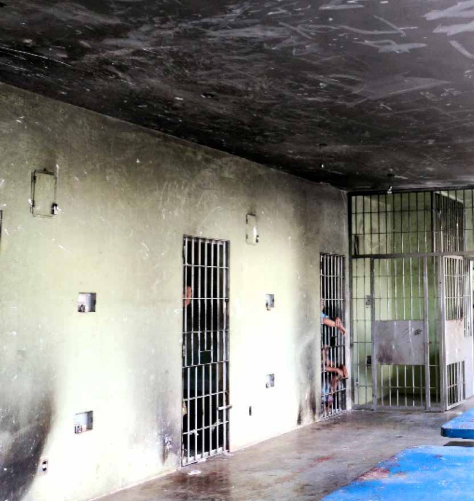
Unidade socioeducativa no Distrito Federal.