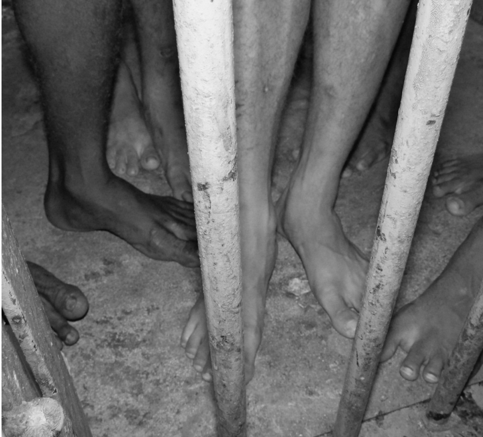
Unidade do Complexo Penitenciário de Pedrinhas, no Maranhão.