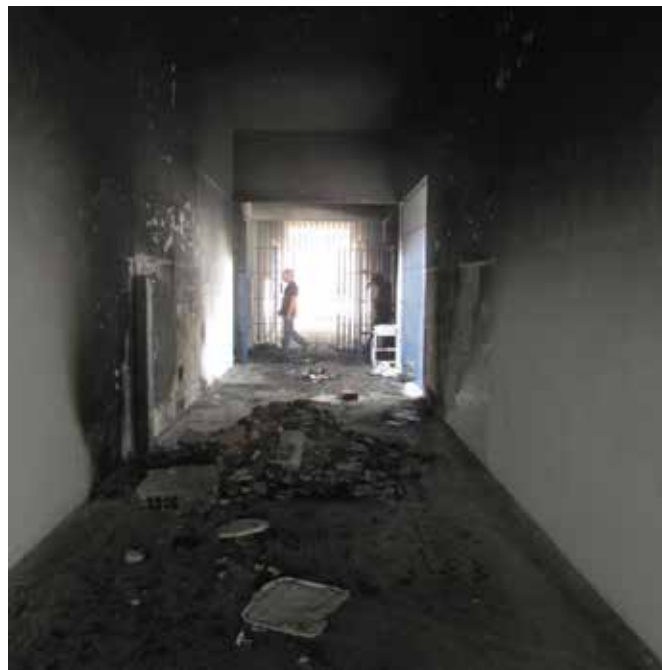
Unidade socioeducativa no Ceará.

139. O SINASE também estipula que as unidades socioeducativas devem ter condições físicas adequadas 48 e estabelece que sua estrutura física deve ser orientada por um Plano Político Pedagógico (PPP) 49 . A arquitetura da unidade deve ser concebida, pois, como um espaço que permita o desenvolvimento do adolescente, privilegiando a humanização dos ambientes e visando o caráter pedagógico da instituição.