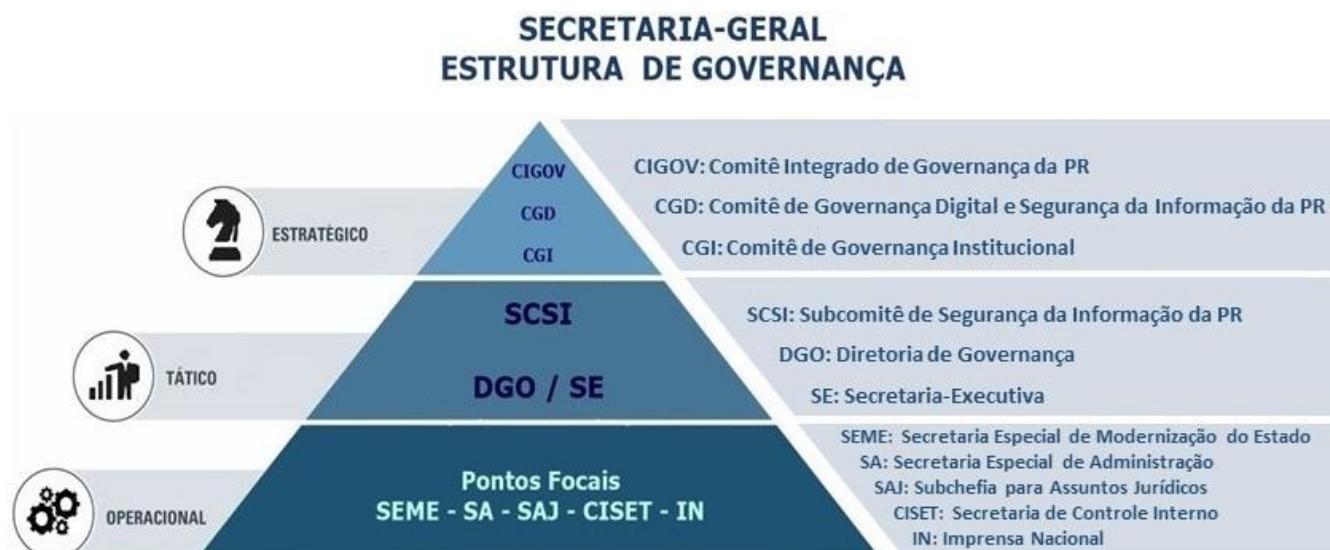
Figura 3 – Estrutura de governança da Secretaria-Geral.

A Secretaria-Geral possui em sua estrutura áreas de governança especializadas e comitês que tratam desse assunto. Além disso, há também comitês, no âmbito da Presidência da República, nos quais esse órgão atua como membro. Essa estrutura de governança que envolve a SG/PR está organizada em uma visão sistêmica, conforme a figura a seguir.