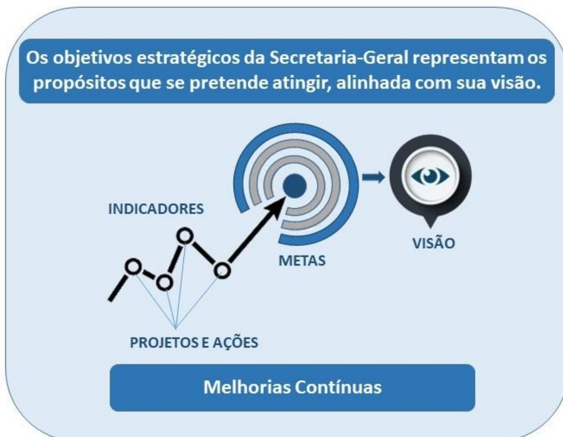
Figura 7 – Visão sistêmica da metodologia de planejamento estratégico com seus objetivos.

Os objetivos estratégicos da Secretaria-Geral da PR, considerando que representam os propósitos do que se pretende atingir, foram definidos de forma alinhada com sua visão de futuro. Esses objetivos são compostos por indicadores que buscam demonstrar a evolução e o andamento de suas ações, observando as metas definidas.