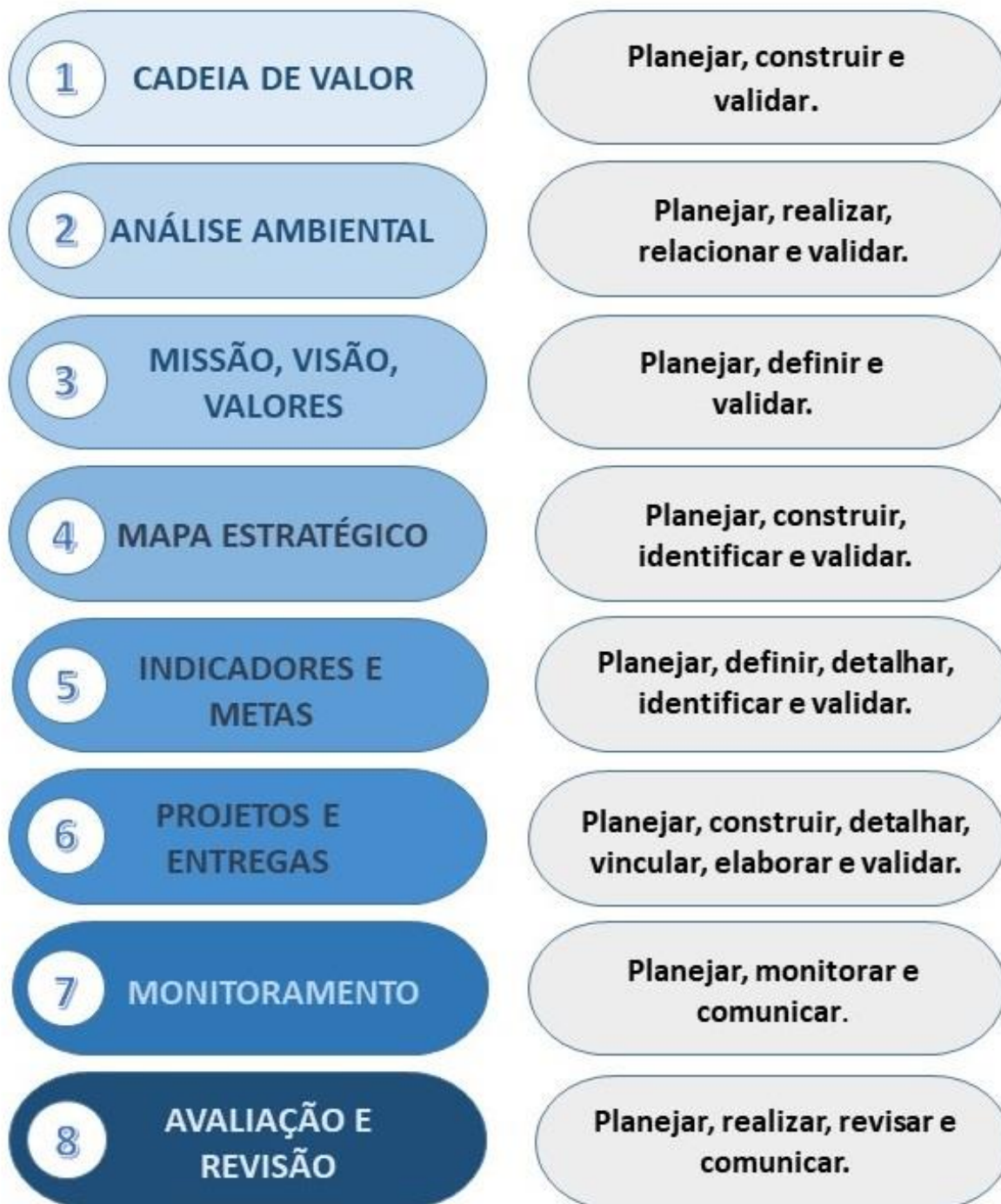
Figura 1: Etapas do Planejamento Estratégico da Secretaria-Geral da PR. Autor: Elaboração própria.