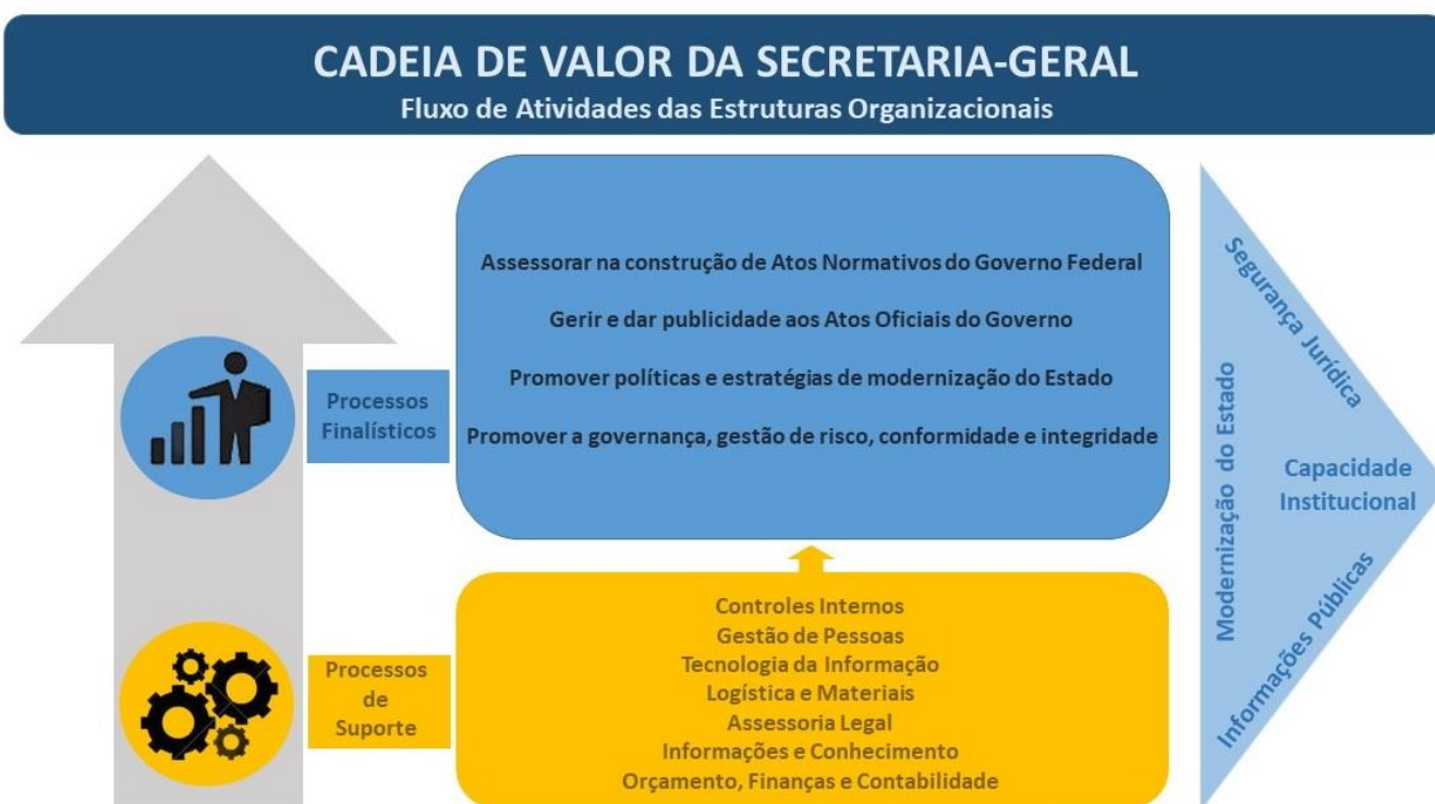
Figura 4 – Cadeia de Valor da Secretaria-Geral.

A figura a seguir ilustra a cadeia de valor da Secretaria-Geral, revisada em 2021, apresentando: na base, os processos de suporte; acima, os processos finalísticos; e no lado direito, os valores públicos.