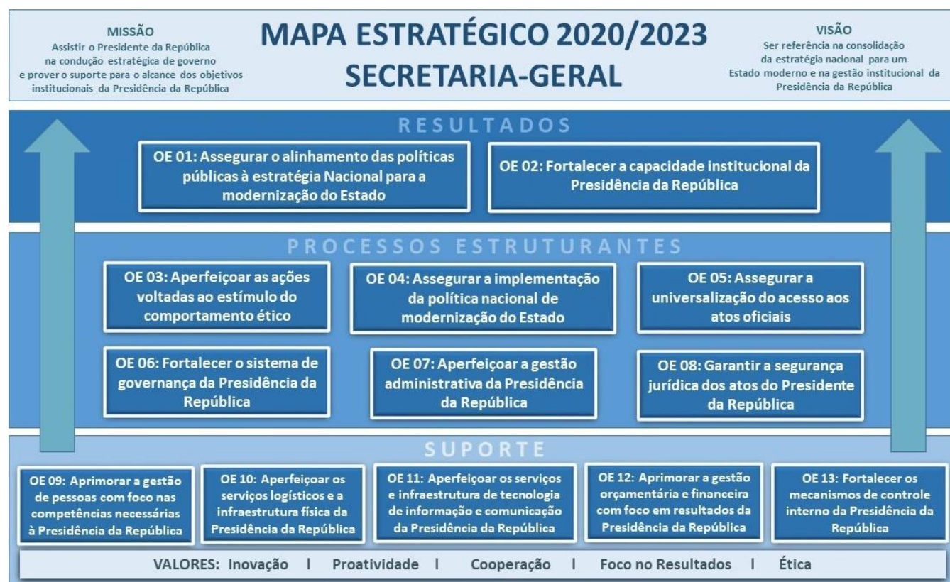
Figura 6 – Mapa Estratégico da Secretaria-Geral da Presidência da República.

O Mapa Estratégico da Secretaria-Geral para o período 2020-2023, representado na figura a seguir, inclui atualizações a partir de mudanças institucionais ocorridas no órgão e, portanto, está alinhado e compatível com as competências regimentais da Secretaria.