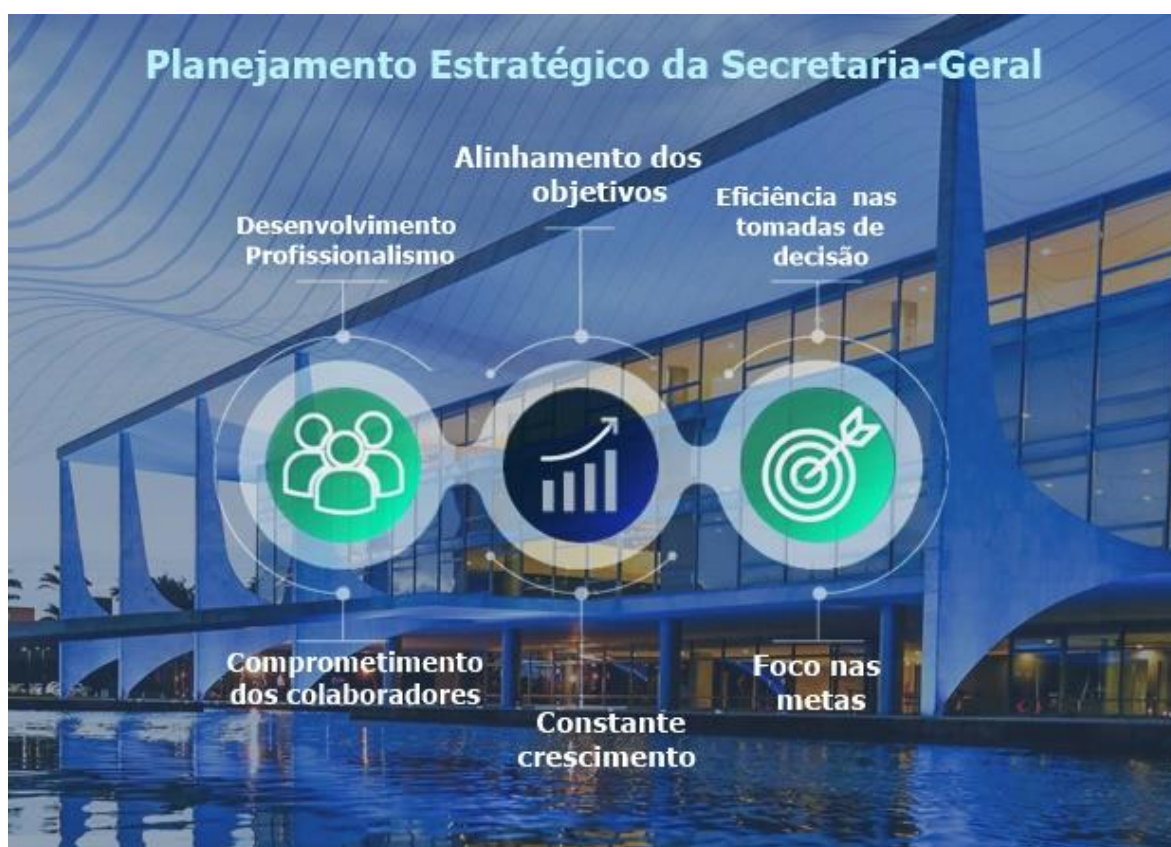
Figura 8 – Visão sistêmica do planejamento estratégico da Secretaria-Geral.

O desenvolvimento do Planejamento Estratégico contou com a participação de todas as unidades e foi resultado de um trabalho de construção coletiva que busca o seu aperfeiçoamento por meio do monitoramento e avaliação periódicos. Nesse sentido, já estão sendo realizados esforços das unidades envolvidas para a realização do monitoramento, buscando garantir uma implementação efetiva do ciclo de gestão institucional. Esse acompanhamento contínuo das ações realizadas, por meio dos indicadores e metas, é fundamental para ajustar possíveis desvios e avaliar o alinhamento dessas variáveis em relação à estratégia definida.