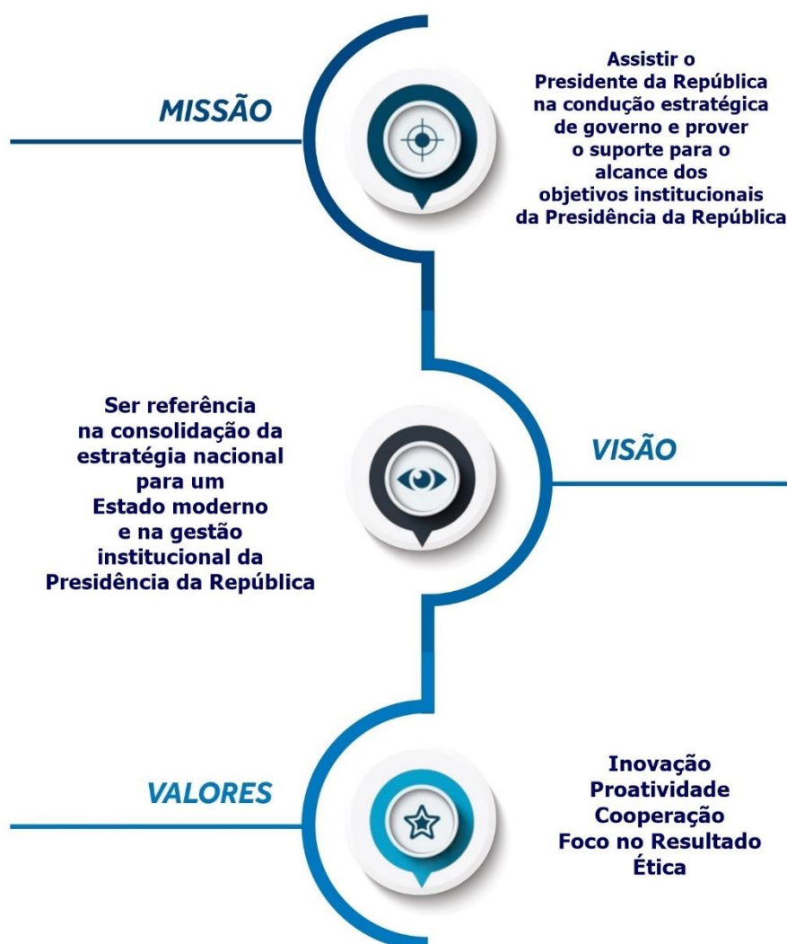
Figura 5 – Referencial Estratégico da Secretaria-Geral da Presidência da República.

A seguir, serão apresentados a missão, visão de futuro e os valores da Secretaria-Geral da Presidência da República, tendo sido definidos para o período de 2020 a 2023, considerando que estão alinhados aos propósitos e ações desse órgão.