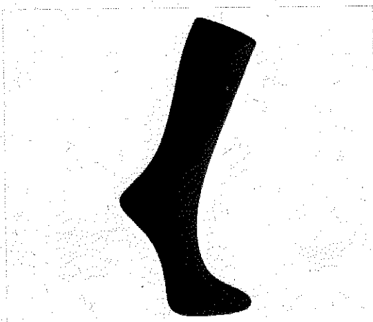
Passa o mouse para ampliar a foto

HOME >> MEIAS TECIDOS 100% ALGODÃO MEIA SOCIAL LUPO REFINATA MASCULINA 100% ALGODÃO PRETA