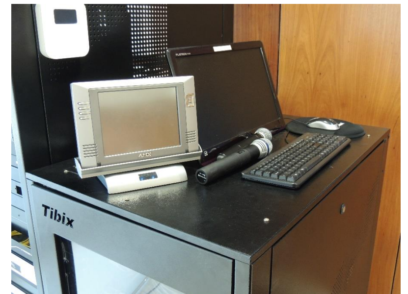
Ambiente Sala de Audiências