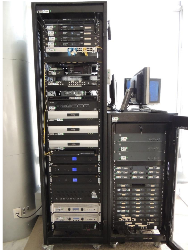
Ambiente Salão Oeste