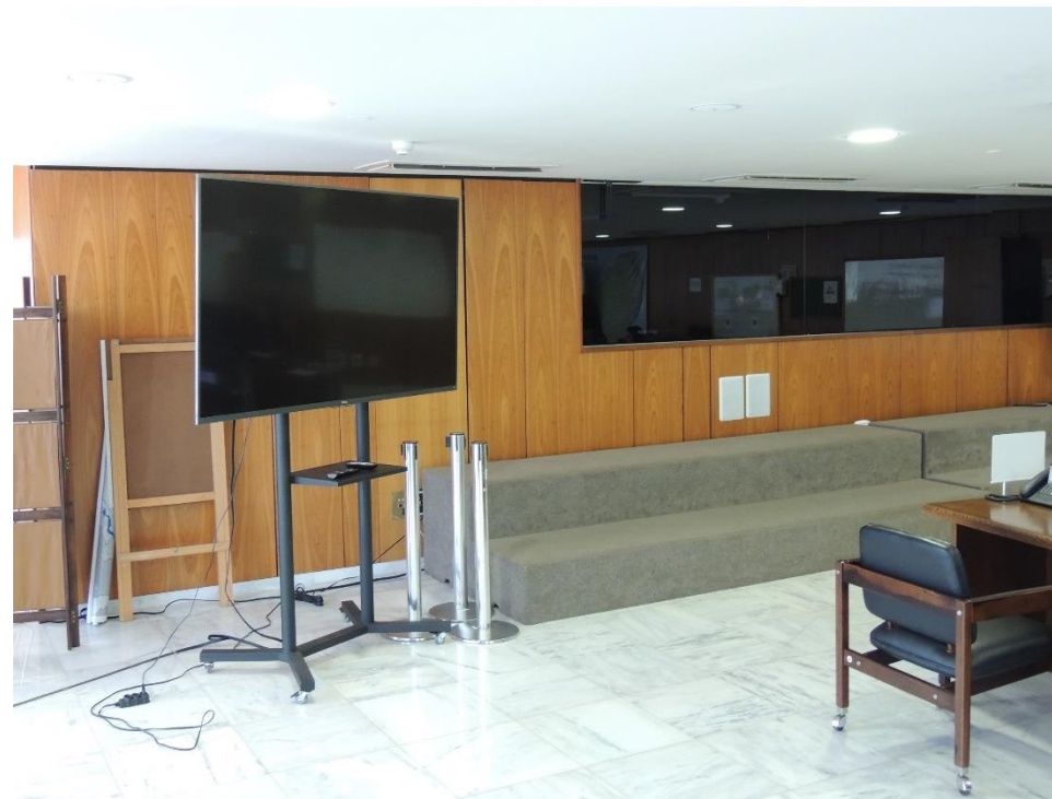
Ambiente Sala Suprema