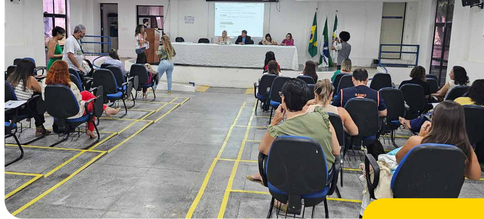
Reunião da Comissão Intergestores Bipartite na Escola de Saúde Pública do Rio Grande do Norte