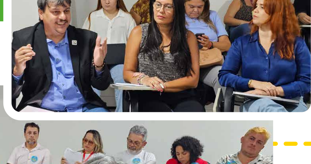
Encontro com as(os) trabalhadoras(es) na Superintendência Estadual do Ministério da Saúde no Rio Grande do Norte

Levantamento realizado pelo Fundo Nacional de Saúde, segundo dados do repasse do mês de janeiro de 2024.