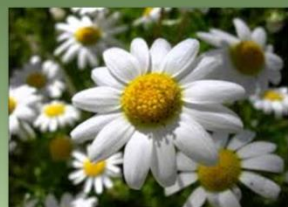
Matricaria chamomilla CAMOMILA