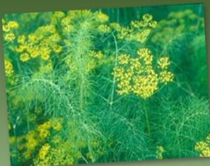
Foeniculum vulgare FUNCHO