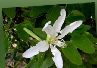
Bauhinia forficata PATA DE VACA