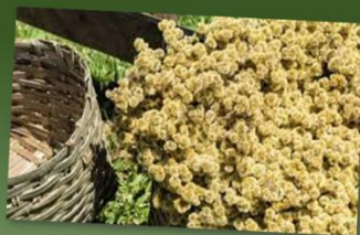
Achyrocline satureioides MARCELA