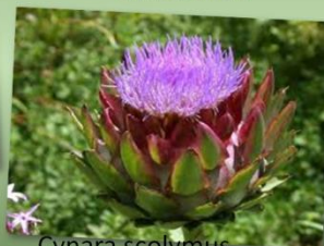
Cynara scolymus ALCACHOFRA