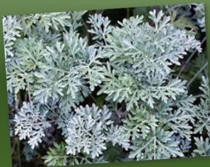
Artemisia absinthium LOSNA