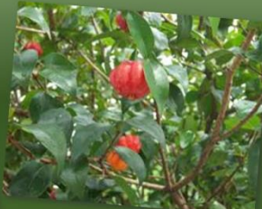
Eugenia uniflora PITANGA

META 5: Efetuar levantamento das plantas medicinais mais utilizadas no RS seguindo o modelo da RENISUS a fim de subsidiar o desenvolvimento do APL PMFito/RS e orientar estudos e pesquisas que possam subsidiar a elaboração da REMEFITO/RS (Relação Estadual de Plantas Medicinais e Fitoterápicos).