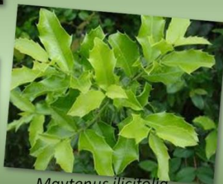
Maytenus ilicifolia ESPINEIRA SANTA