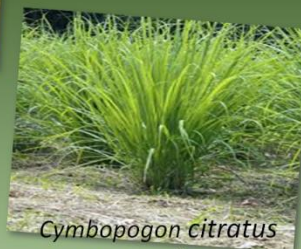
Cymbopogon citratus CAPIM LIMÃO