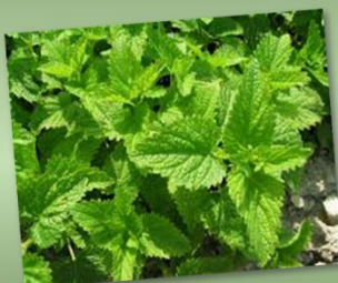
Melissa officinalis ERVA-CIDREIRA