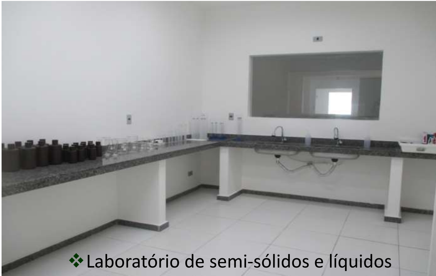
❖ Laboratório de semi-sólidos e líquidos