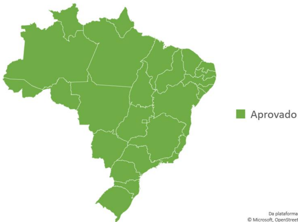
Gráfico 1 – Situação atual dos planos estaduais.