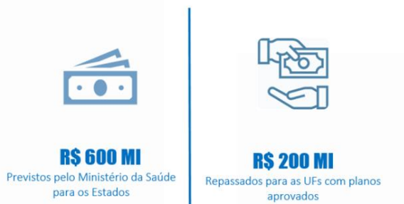
Figura 2 - Situação atual dos recursos financeiros do PNRF