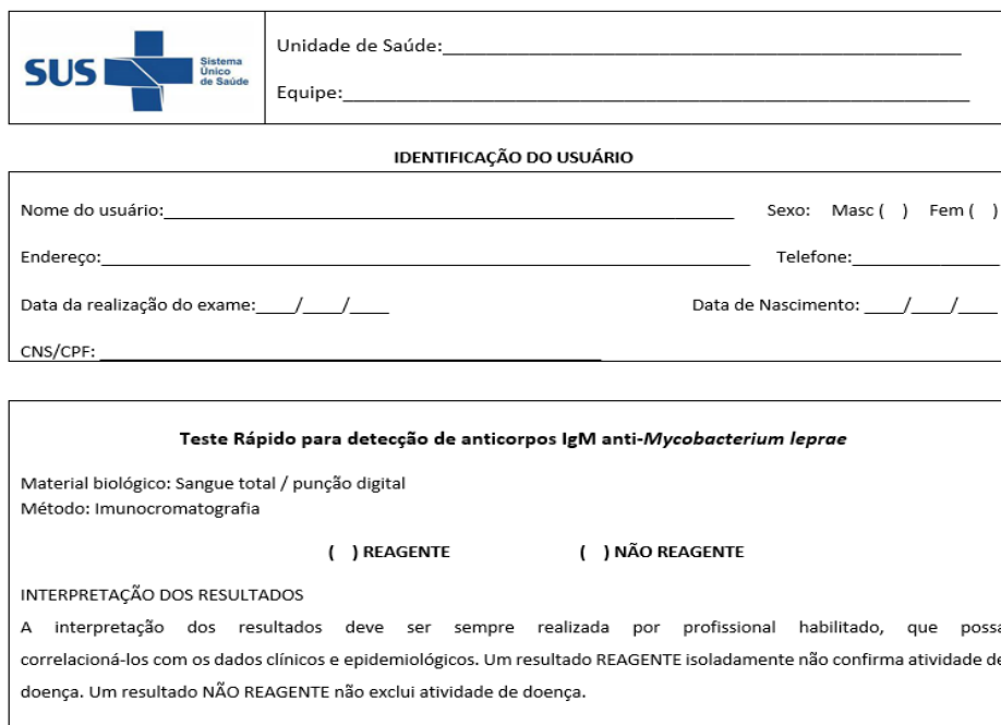
Figura 5. Modelo de laudo para o teste rápido da hanseníase.