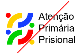
NÃO ALTERAR A TIPOGRAFIA