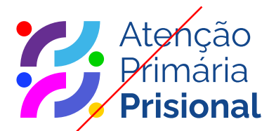
NÃO ALTERAR CORES