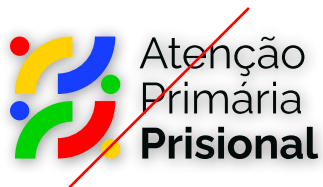
NÃO APLICAR EFEITOS