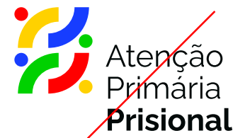
NÃO REPOSICIONAR OS ELEMENTOS