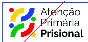
NÃO APLICAR MOLDURA