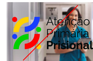
NÃO APLICAR DIRETAMENTE SOBRE FUNDOS INSTÁVEIS