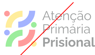
NÃO APLICAR COMO MARCA D'ÁGUA