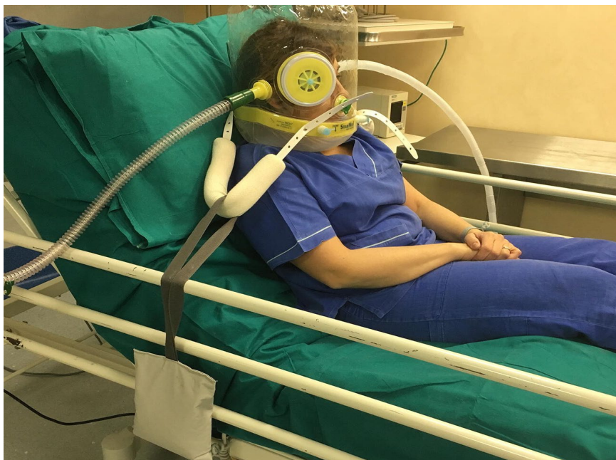
Figura 3. Capacete para Ventilação Não Invasiva, utilizado com o sistema de fixação de contrapesos.

de saúde tem sido inferior à quantidade total de pacientes com COVID-19 que tenham indicação para VNI ou CPAP. Desse modo, esses concluem que o uso dos capacetes para VNI em enfermarias evitaria a necessidade de internação desses pacientes em UTI (8).