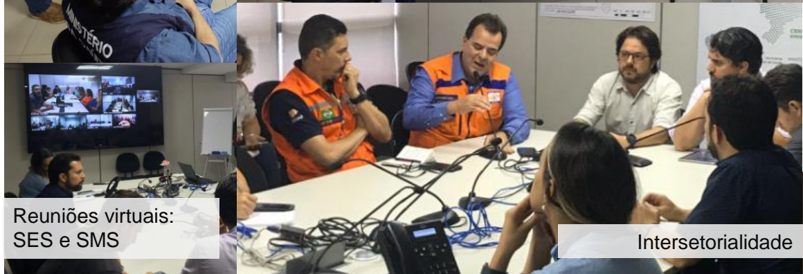
Reuniões virtuais: SES e SMS