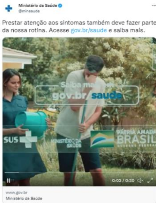
Internet – Twitter