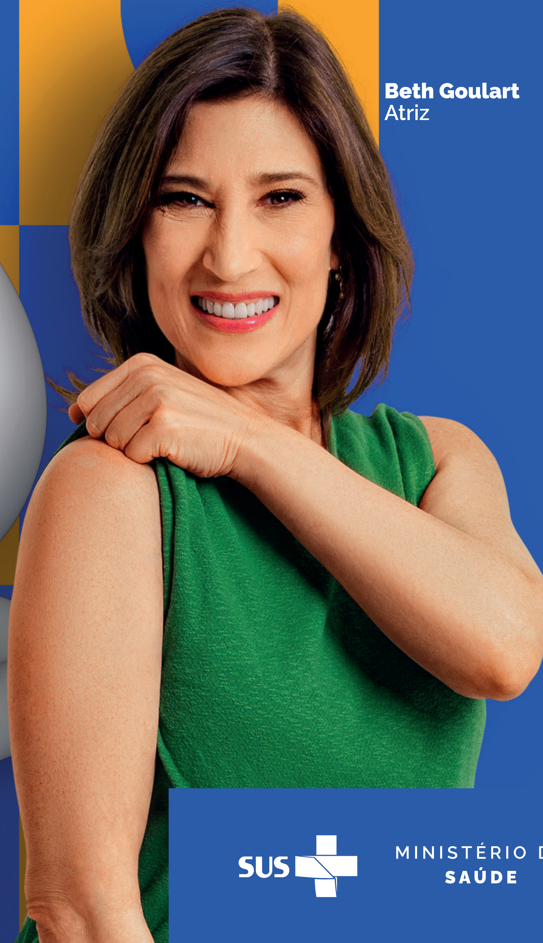
Beth Goulart Atriz