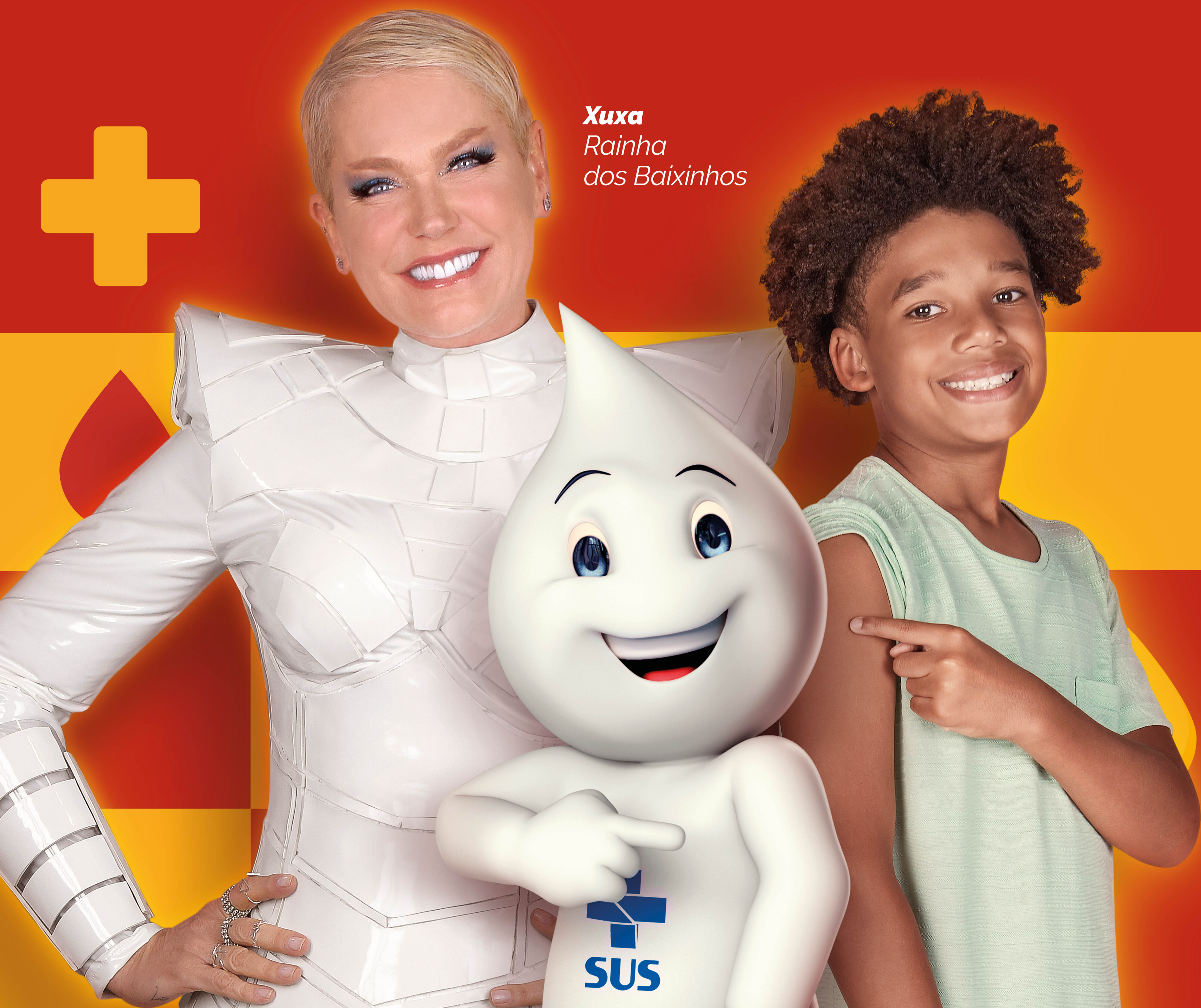
Xuxa Rainha dos Baixinhos

ATUALIZE A CADERNETA DE VACINAÇÃO DE CRIANÇAS E ADOLESCENTES MENORES DE 15 ANOS.