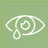
Lacrimejamento com secreção