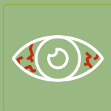
Vermelhidão e irritação nos olhos