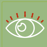
Ardência, com sensação de areia