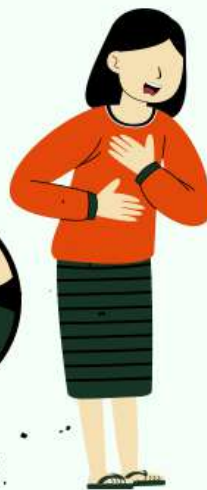
DOR NO CORPO