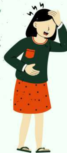
DOR DE CABEÇA

Caso estes sintomas ocorram após a exposição ao carrapato, procure a unidade básica de saúde mais próxima da sua casa.