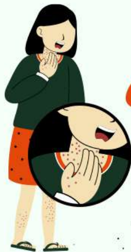
MANCHAS VERMELHAS PELO CORPO