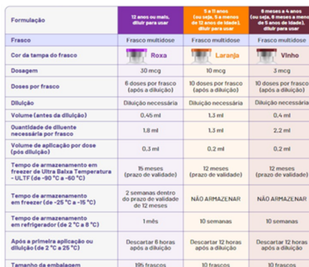
Figura 2 - Apresentação da vacina Comirnaty (covid-19) Pfizer.

Referência: bula do produto < https://www.pfizer.com.br/bulas/comirnaty >