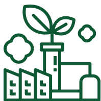
Aquisição/manipulação de fitoterápico

Compra de fitoterápico industrializado ou manipulado;