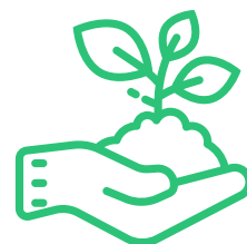
Plantio de Plantas Medicinais

Fornecimento de mudas de plantas medicinais no âmbito das farmácias vivas, hortos terapêuticos e ervanários;