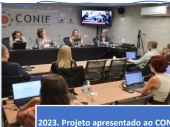
2023. Projeto apresentado ao CONIF