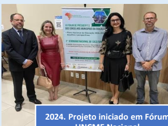
2024. Projeto iniciado em Fórum UNCME Nacional