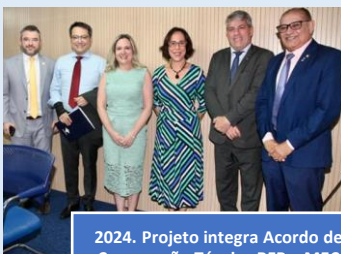
2024. Projeto integra Acordo de Cooperação Técnica RFB e MEC