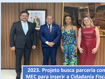
2023. Projeto busca parceria com MEC para inserir a Cidadania Fiscal no Currículo Escolar