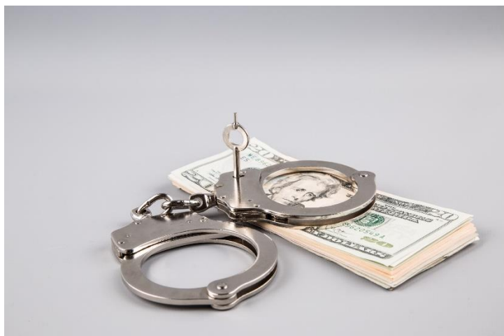
Imagem do Microsoft BIG, disponível no pacote Office MS 365.

3) Comente a imagem abaixo, relacionando-a com o tema estudado.