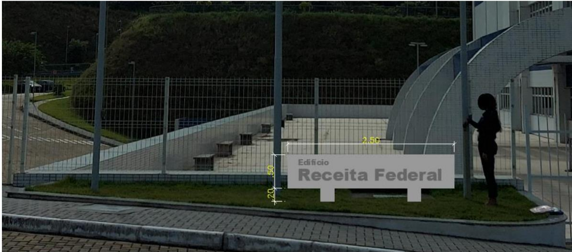
Placa em concreto (2.50x0.50m) com texto (Arial black) em baixo relevo e dois apoios.